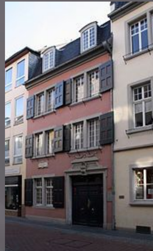
Дом, в котором родился Бетховен

Предположительно датой рождения считается 16 декабря 1770 г.