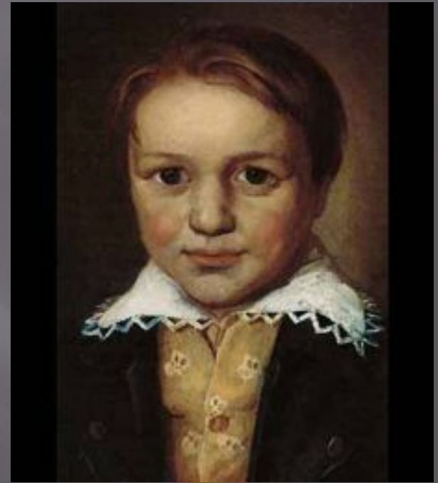
Портрет Бетховена в 13-летнем возрасте

Настоящим учителем Бетховена стал Кристиан Готлоб Нефе. Он познакомил Людвига с творчеством Баха и Генделя. Благодаря Нефе, было издано и первое сочинение Бетховена — вариации на тему марша Дресслера. Бетховену в то время было двенадцать лет, и он уже работал помощником придворного органиста.