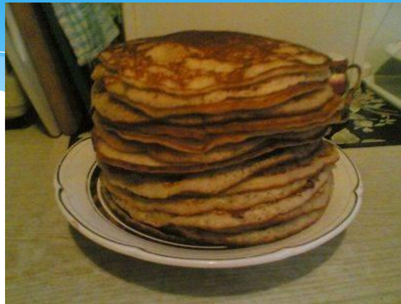
Начинают печь блины.