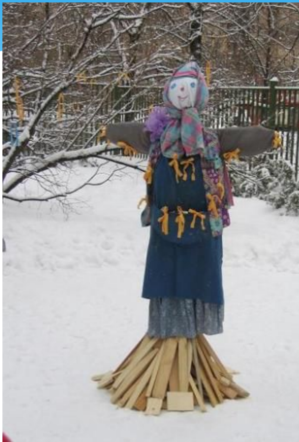
Наряжают кукл- чучело.