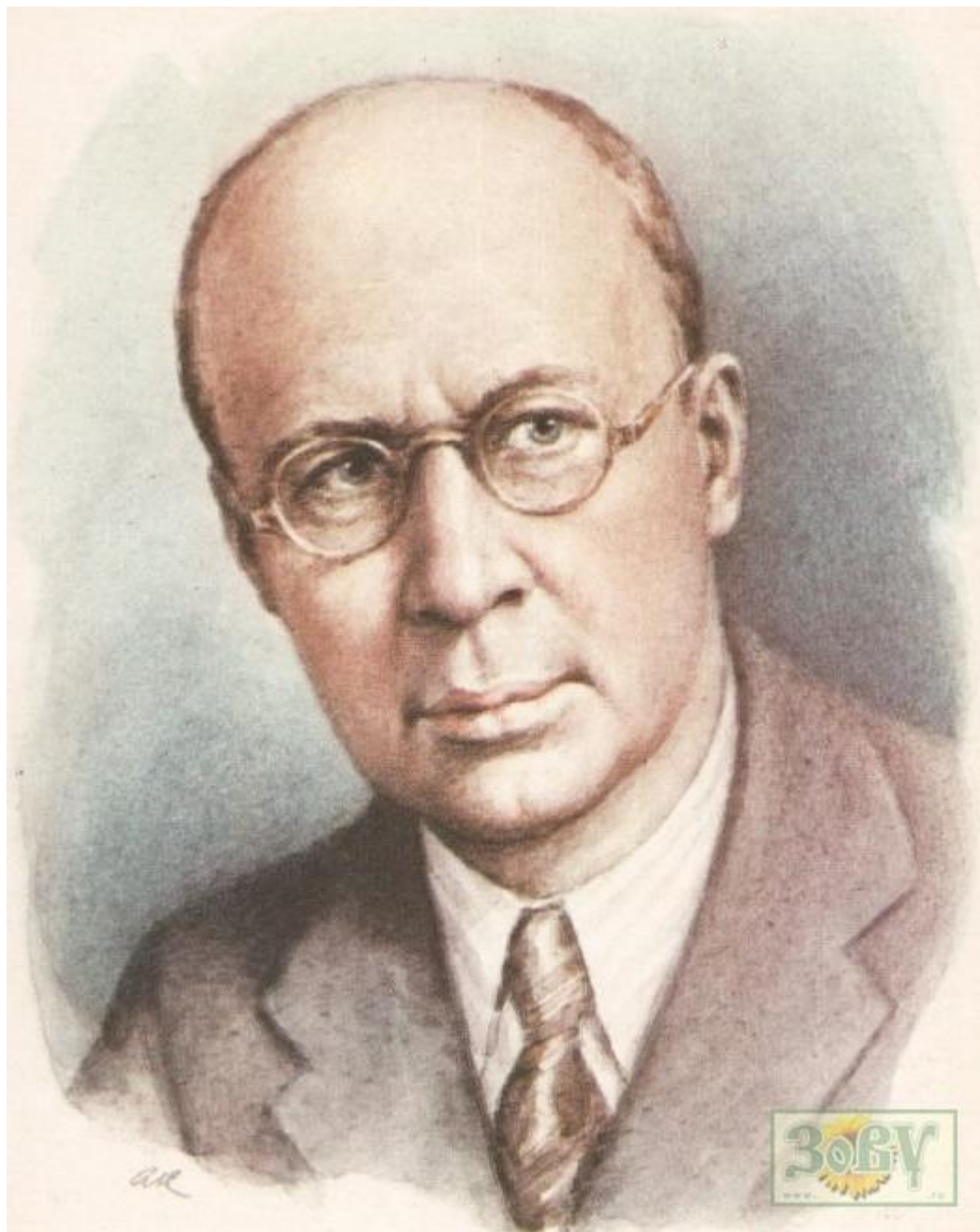
С.С. Прокофьев (1891 – 1953) «Болтунья» Сл.А.Л.Барто