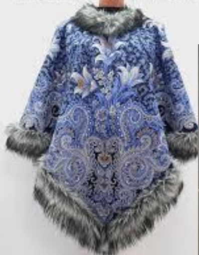
Авторский жилет от Ирины Соловей