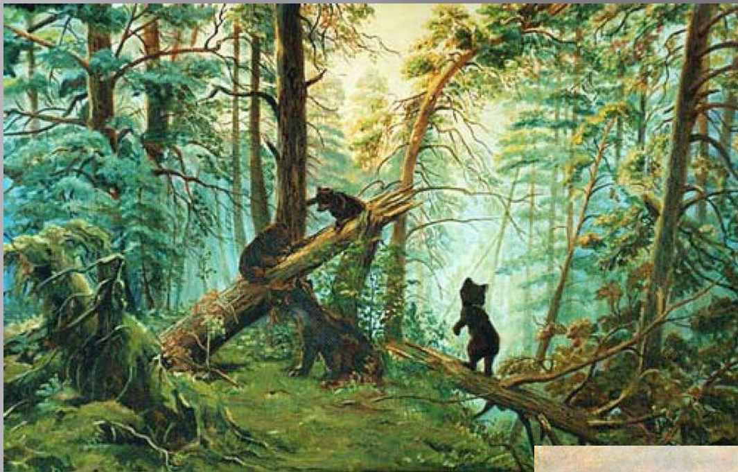
Шишкин Иван Иванович – картина Утро в сосновом лесу