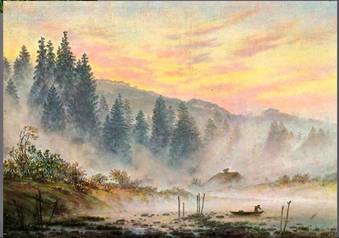
Капар Фридрих - картина Утро.