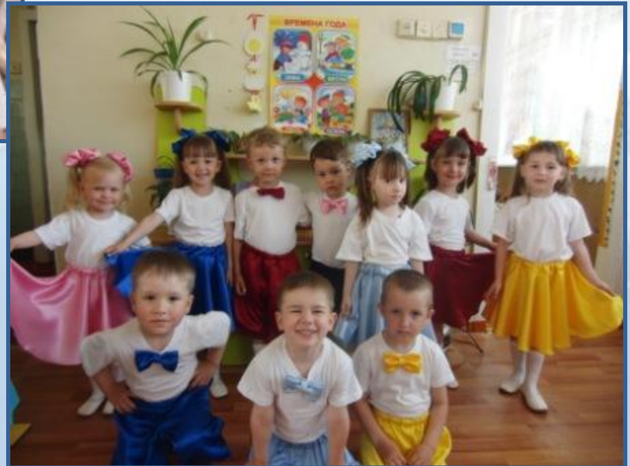
Танец «Губки бантиком»