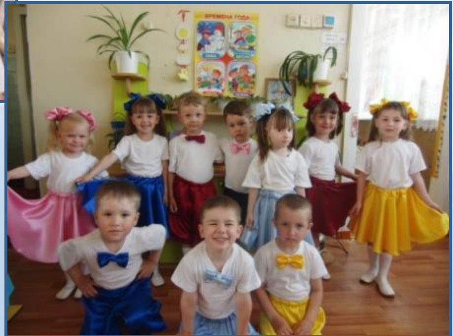
Танец «Губки бантиком»