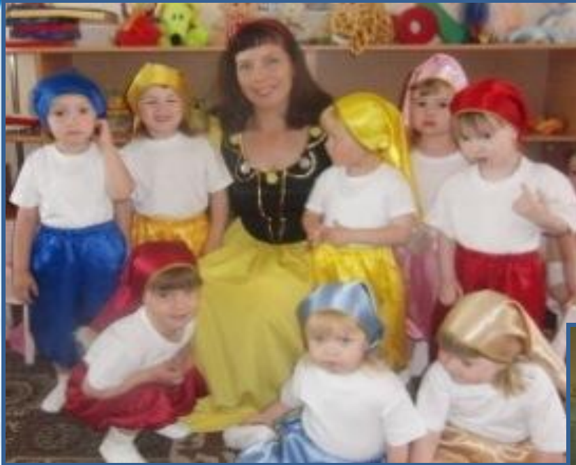
Танец «Белоснежка и гномы»