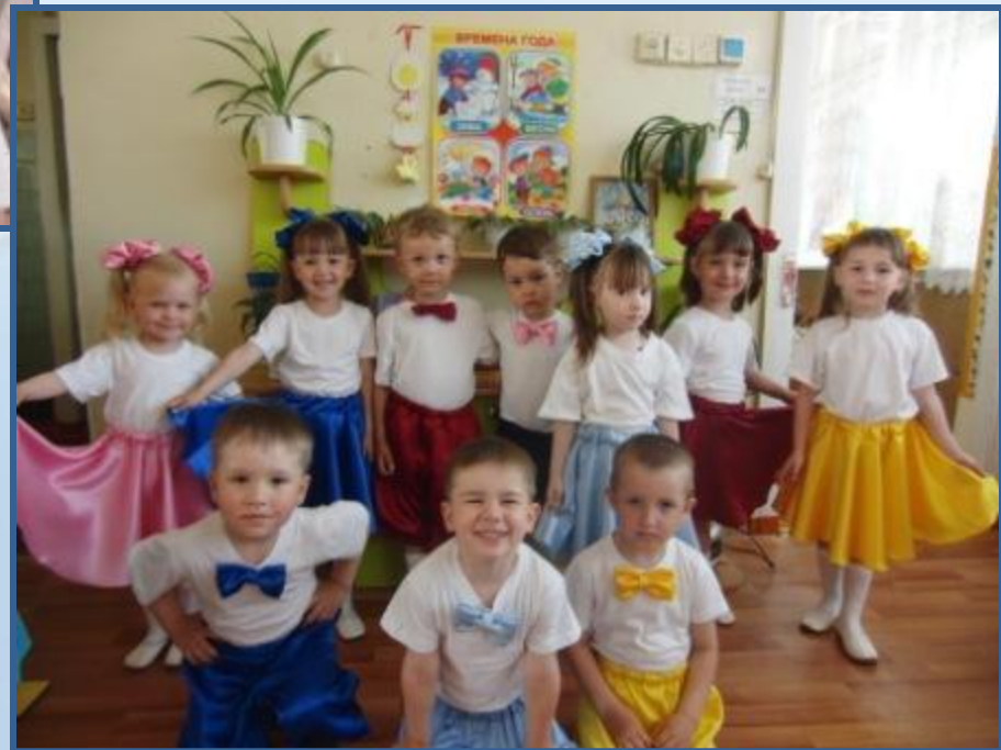
Танец «Губки бантиком»