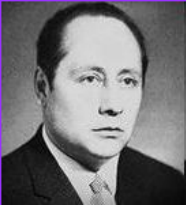
Яхин Рустем Мухаметхазеевич (1921—1993)