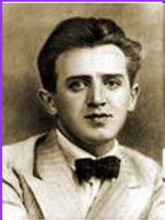
Сайдашев Салих Замалетдинович (1900-1954)