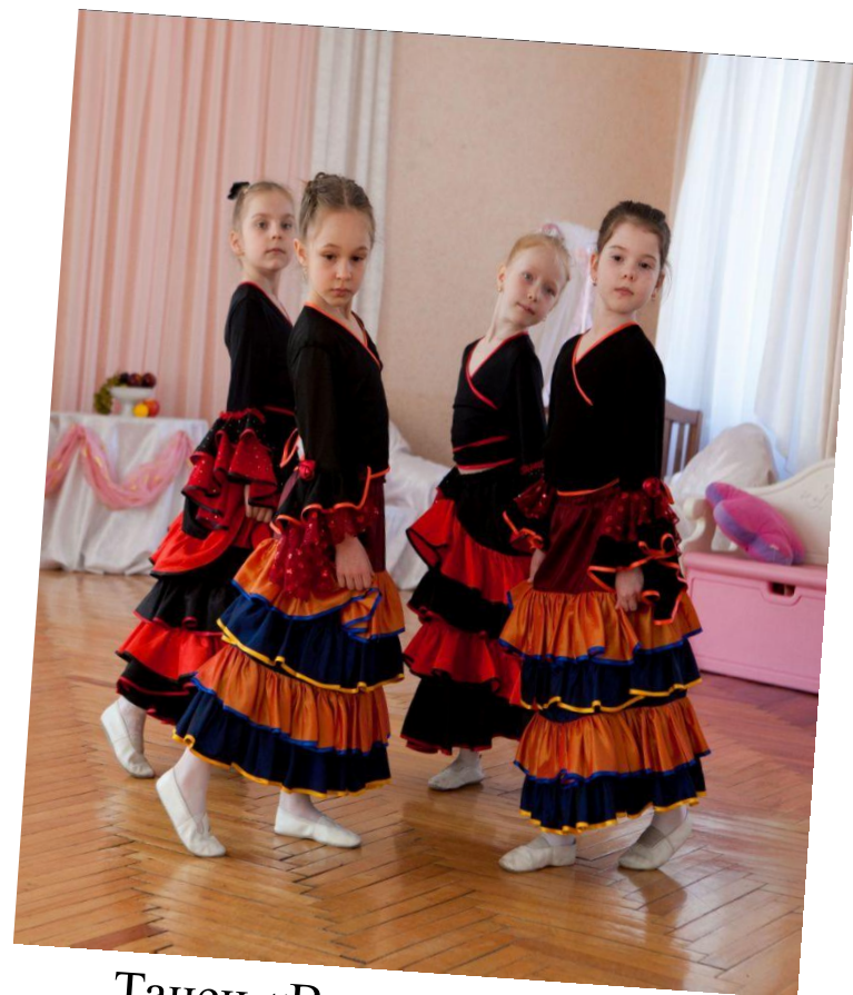
Танец «В старинном замке»