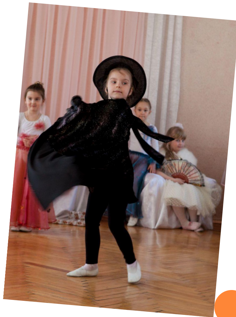
Злая фея Карабос