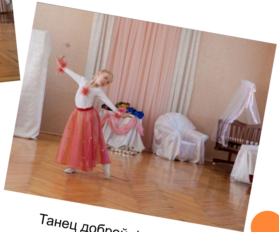
Танец доброй феи