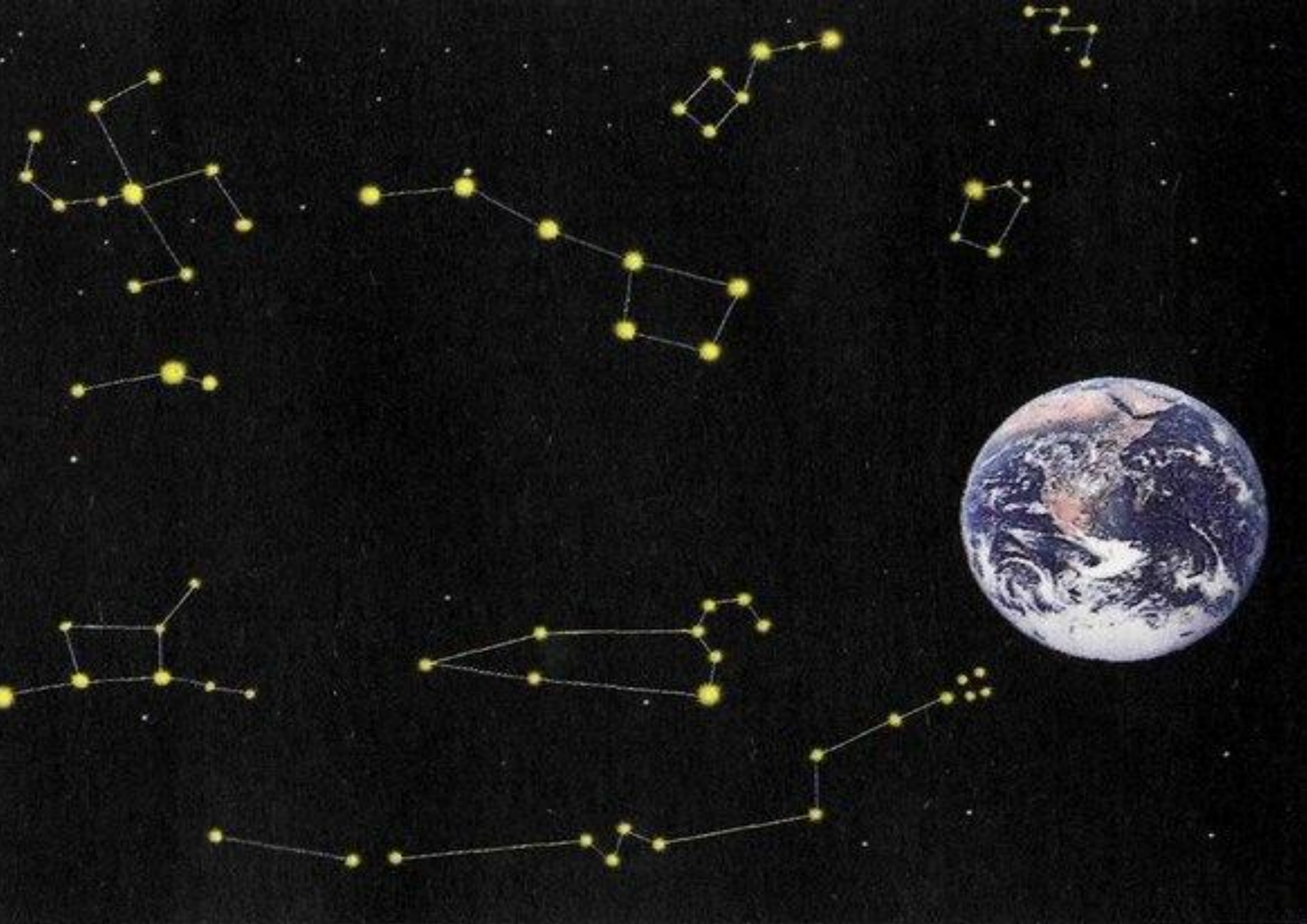
Нахождение созвездия Свастики в северном полушарии.