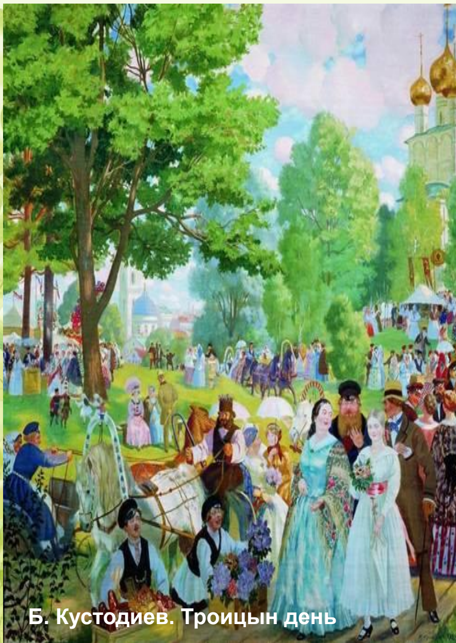
Б. Кустодиев. Троицын день