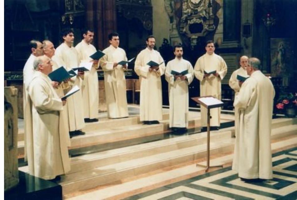
Мужской григорианский хор

С распадом Римской империи (395) произошло разделение церкви на зап. католическую и вост. православную, различающиеся ритуалом и муз. оформлением культа. Католич. папская церковь скоро распространила влияние почти на всю Зап. Европу. Возник ряд местных центров католицизма со своими вариантами литургии: кроме римской и миланской (амвросианской) - староиспанская (мозарабская), старофранцузская (галликанская), кельтская (британо-ирландская). Но постепенно все региональные традиции (кроме миланской) были вытеснены официальным римским хоралом, названным в честь папы Григория Великого (ок. 540-604) григорианским (см. Григорианское пение ). Важный этап в эволюции григорианского хорала связан с именами папы Виталия (657-72) и аббатов собора св. Петра Котоленуса, Мариануса и Вирбонуса (между 653 и 680). Окончательно свод григорианских песнопений сложился к кон. 9 в. Отрывки из Ветхого и Нового заветов читались нараспев в виде литургич. речитатива. Псалмы исполнялись в более распевной, чем ранее. Мелодич. основу чтений и псалмов составляли особые формулы-попевки (initium, mediatio, punctum), строго классифицированные в соответствии со ср.-век. системой 8 церк. ладов (модусов, или тонов; см. Средневековые лады ): для чтений предназначались т. н. Lektionstöne (нем.), для псалмов - Psalmtöne , для молитв - Orationstöne и т. д. Кроме чтений и псалмов, в григорианский обиход входили антифоны, респонсории, гимны, кантики.