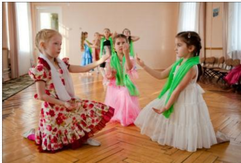
Танец «Статуи» Композиция Л.Кустовой