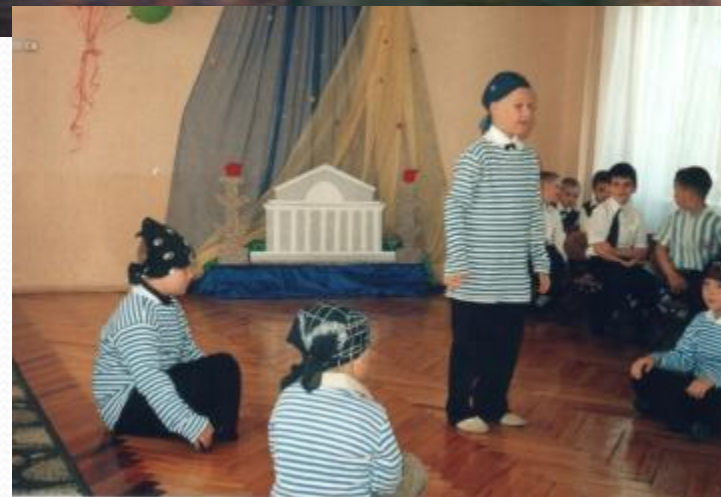
Танец «Морячок» Композиция Л.Кустовой