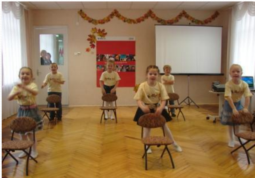
Танец «Пластилиновая ворона» Композиция Л.Кустовой