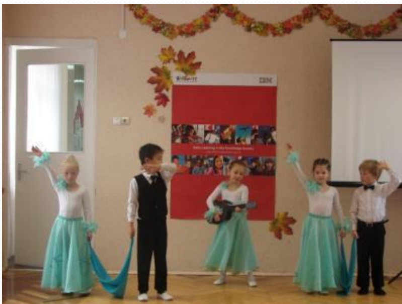
Танец «Алые паруса»