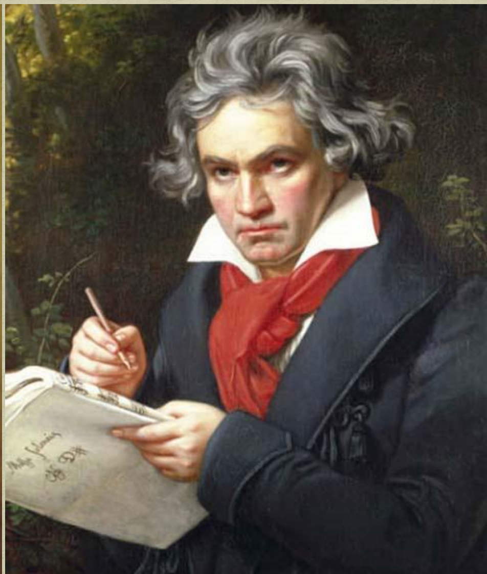
Людвиг ван Бетховен