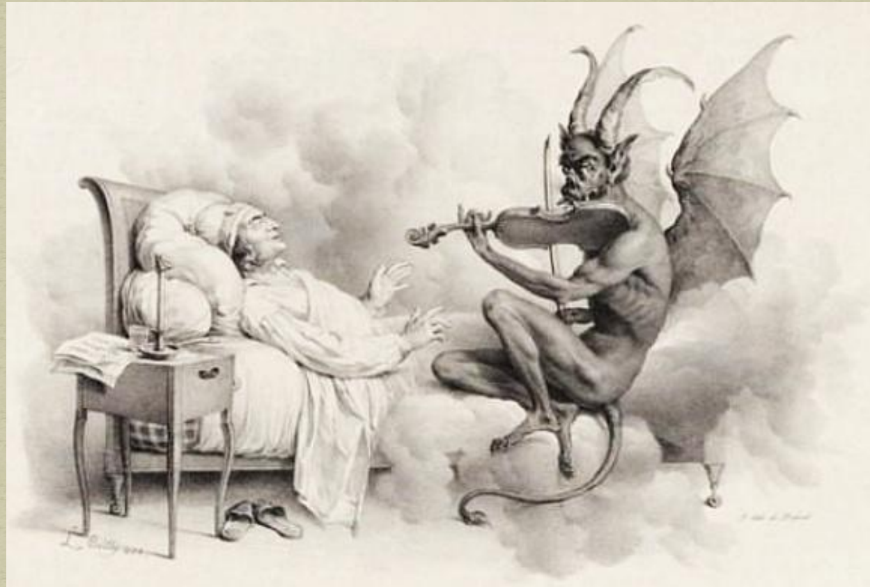
Соната «Трели дьявола»