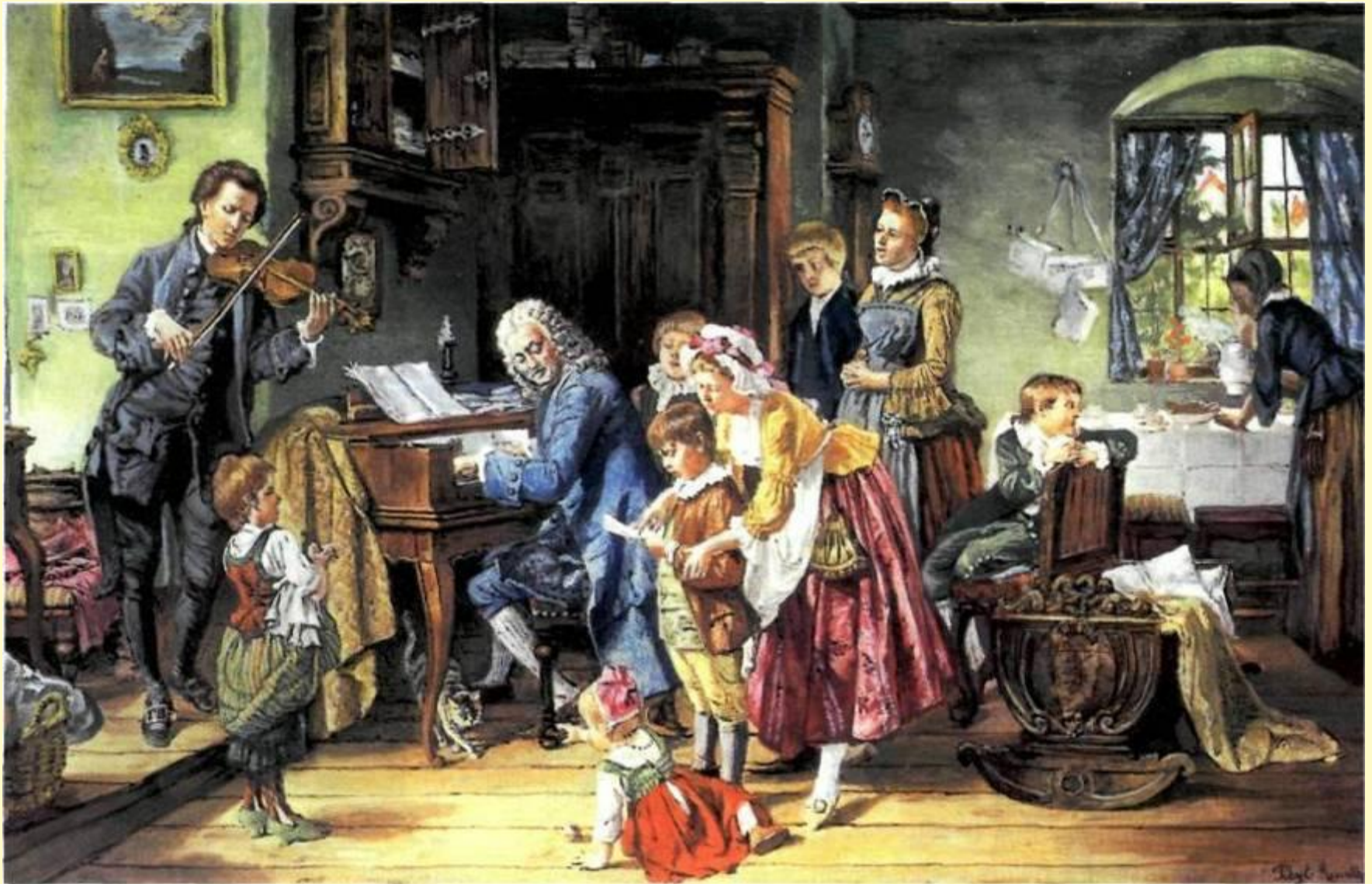
Семья И. С. Баха