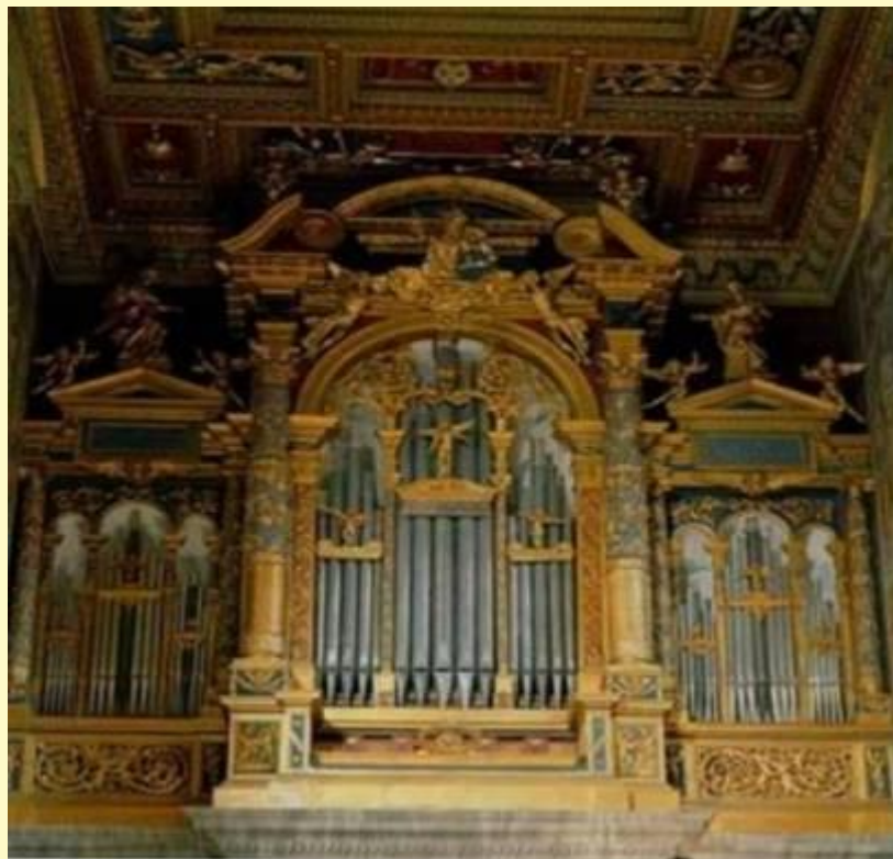
Орган 17 век в церкви Сан Джованни

Орган отливал серебром, Немой, как в руках ювелира, А издали слышался гром, Катившийся из-за полмира. Покоилась люстр тишина И в зареве их бездыханном Играл не орган, а стена, Украшенная органом. Ворочая балки, как слон, И, освобождаясь от брёвен, Хорал выходил, как Самсон, Из кладки, где был замурован.