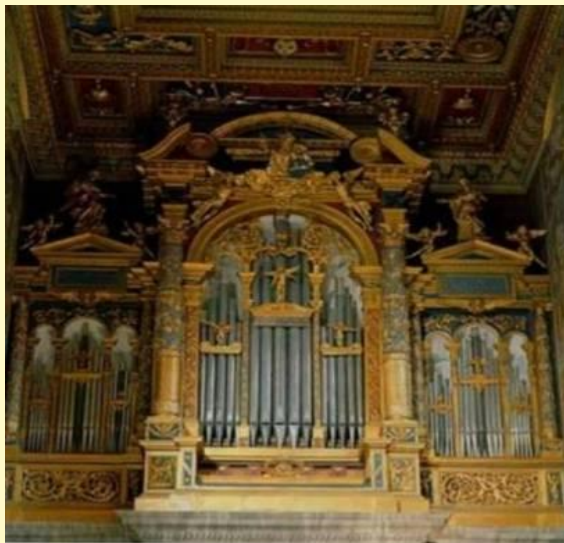
Орган 17 век в церкви Сан Джованни

Орган отливал серебром, Немой, как в руках ювелира, А издали слышался гром, Катившийся из-за полмира. Покоилась люстр тишина И в зареве их бездыханном Играл не орган, а стена, Украшенная органом. Ворочая балки, как слон, И, освобождаясь от брёвен, Хорал выходил, как Самсон, Из кладки, где был замурован.