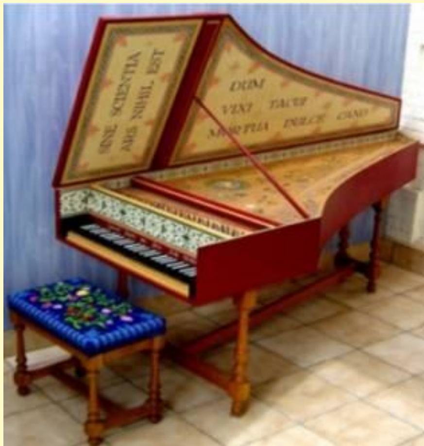
Клавесин XVII век