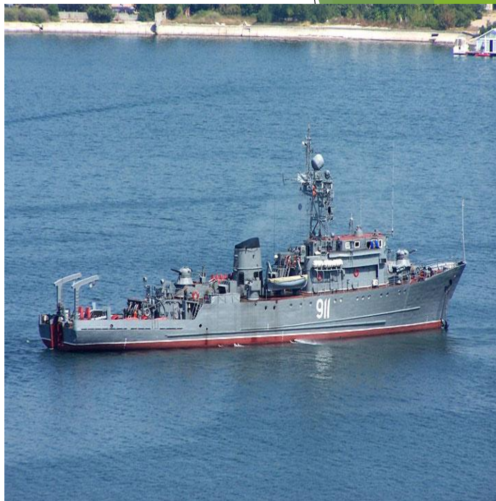
Морской траулер носит имя Ивана Голубца