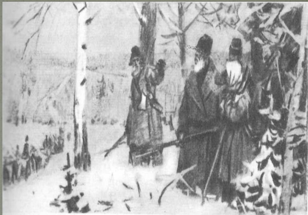
Рисунок Д. Шмаринова