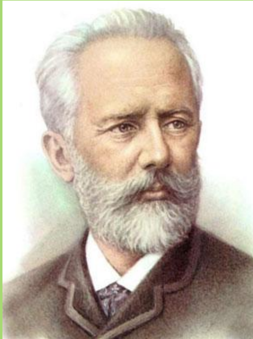
Петр Ильич Чайковский