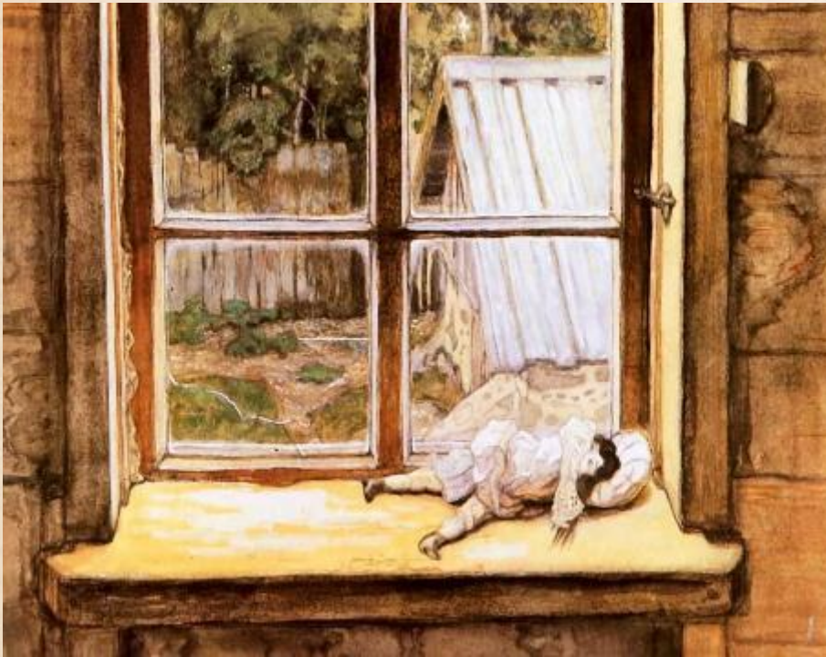
М. Добужинский «Кукла»