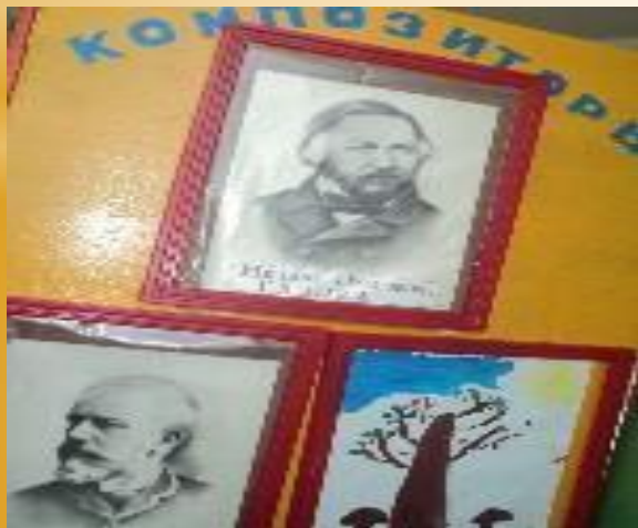
Зона для слушания музыки