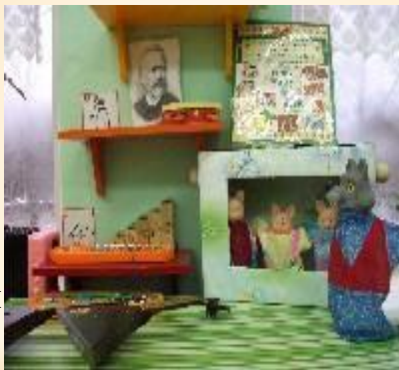
Музыкально-дидактические игры, литература, альбомы