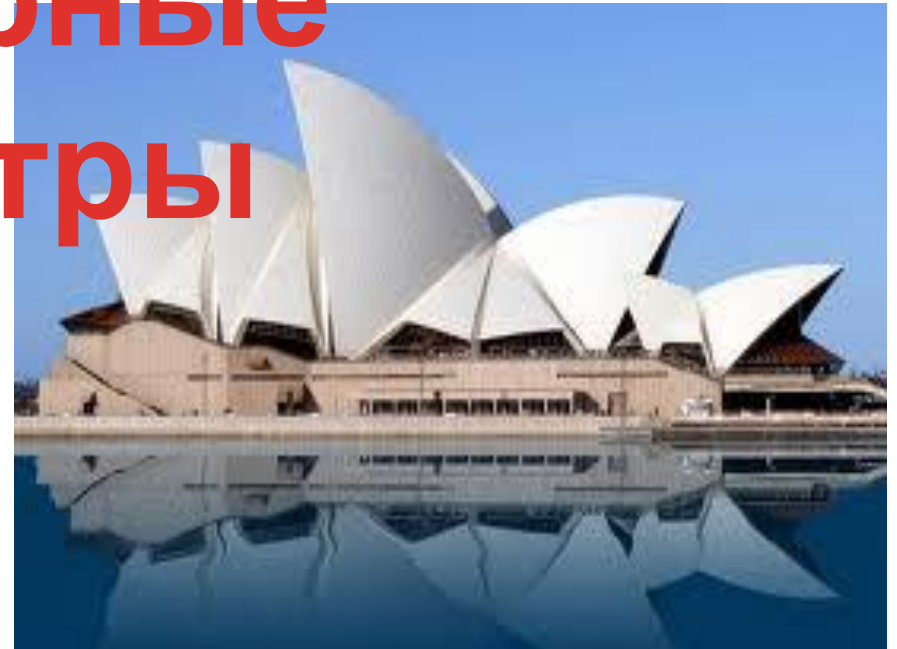
Оперный театр в Сиднее. Австралия.