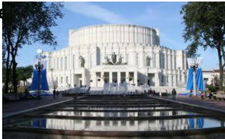
Минский театр оперы и балета