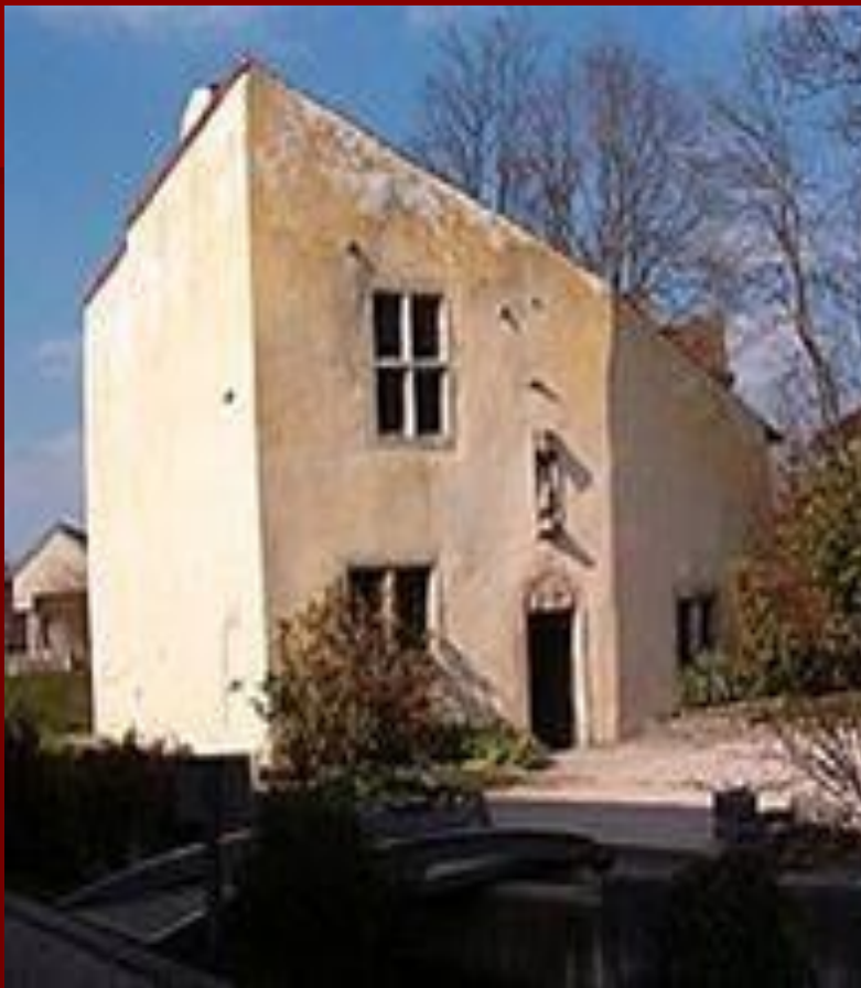
Дом в Дореме, в котором родилась Жанна

В подъеме народной борьбы против захватчиков и их изгнании большую роль сыграла Жанна д'Арк . По описанию современников, это была высокая, сильная и выносливая крестьянская девушка-пастушка. Будучи безграмотной, она, однако, обладала быстрым, находчивым умом и превосходной памятью, хорошо ориентировалась в сложной обстановке. С детских лет Жанна видела бедствия своего народа. Впечатлительной, очень религиозной девушке казалось, что она слышит голоса святых, побуждающих ее к военному подвигу. Она была убеждена, что ей предназначено Богом спасти родину от врага.