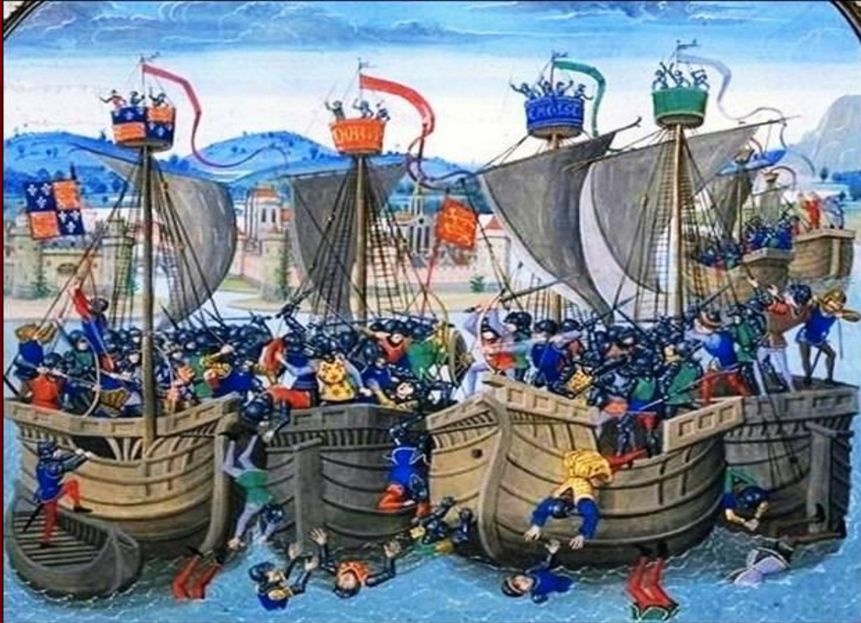
Битва при Слейсе

Располагая сильным флотом, английское войско переправилось через Ла-Манш. В 1340 году в морском сражении в узком проливе при Слэйсе у берегов Фландрии англичане разгромили французский флот, уцелели лишь немногие суда.