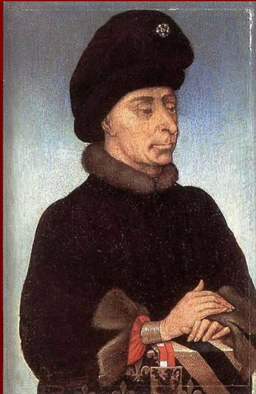
Иоанн Бесстрашный, герцог Бургундский