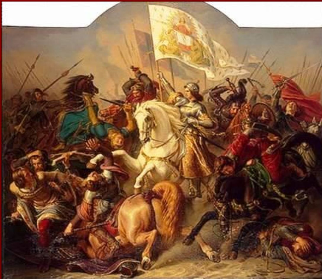
Жанна в бою

Перед походом Жанна д'Арк послала письмо англичанам, стоявшим под стенами Орлеана. Она требовала отдать ей ключи от всех захваченных городов и предлагала мир, если англичане уйдут из Франции и возместят причиненный ущерб. В противном случае Жанна грозила врагам «учинить такой разгром, какого не видели во Франции уже тысячу лет».