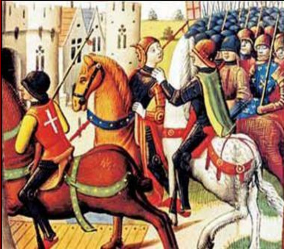
Пленение Жанны д'Арк

Необычный успех и слава крестьянской девушки вызвали зависть у знатных господ. Они хотели оттеснить Жанну от руководства военными действиями, избавиться от нее.