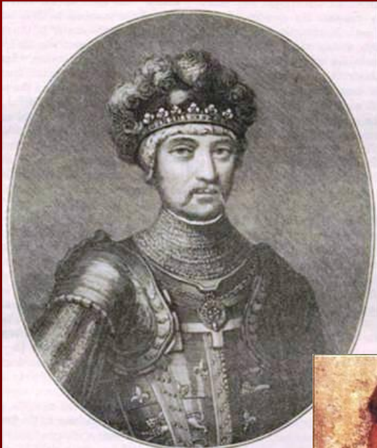
Эдуард «Черный принц»