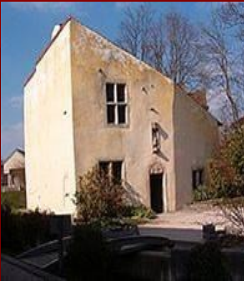
Дом в Дореме, в котором родилась Жанна

В подъеме народной борьбы против захватчиков и их изгнании большую роль сыграла Жанна д'Арк . По описанию современников, это была высокая, сильная и выносливая крестьянская девушка-пастушка. Будучи безграмотной, она, однако, обладала быстрым, находчивым умом и превосходной памятью, хорошо ориентировалась в сложной обстановке. С детских лет Жанна видела бедствия своего народа. Впечатлительной, очень религиозной девушке казалось, что она слышит голоса святых, побуждающих ее к военному подвигу. Она была убеждена, что ей предназначено Богом спасти родину от врага.