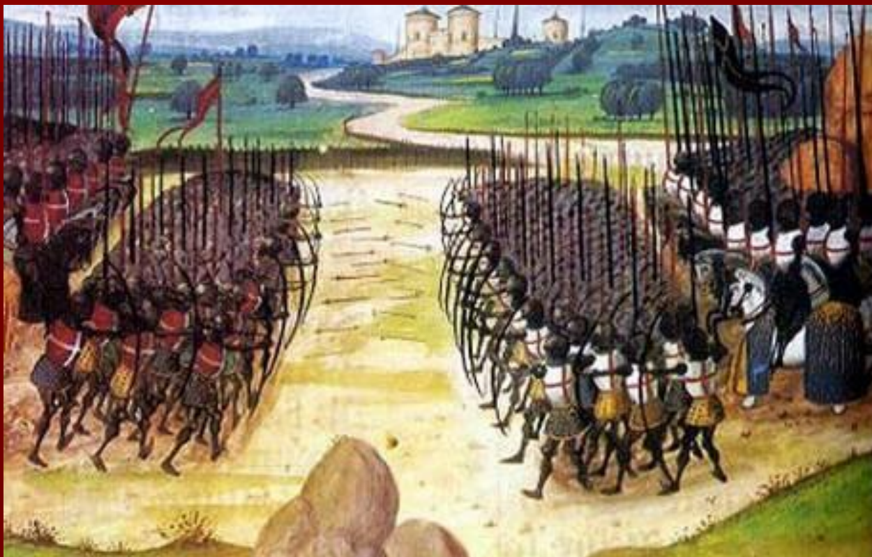
Миниатюра изображающая битву при Азенкуре

В 1415 году большое английское войско высадилось в устье Сены и направилось к Кале. У деревни Азенкур , в 60 км от Кале, французская армия вновь была разгромлена и бежала с поля боя. Погибло много рыцарей, полторы тысячи попали в плен. Поражение было воспринято как «очень большой позор для Французского королевства» .