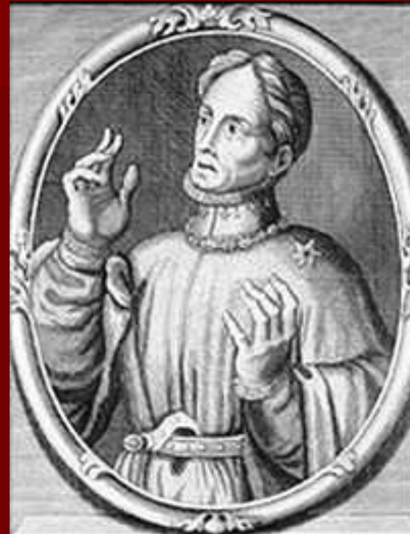
Людвиг, герцог Орлеанский

Однако в конце XIV века положение Франции вновь осложнилось. Страну раздирала борьба двух феодальных групп за власть и влияние на психически больного короля. Во главе их стояли дяди короля — герцог Бургундский и герцог Орлеанский (с его близким родственником графом Арманьяком). Поэтому междоусобные распри были названы войной бургундцев с арманьяками .