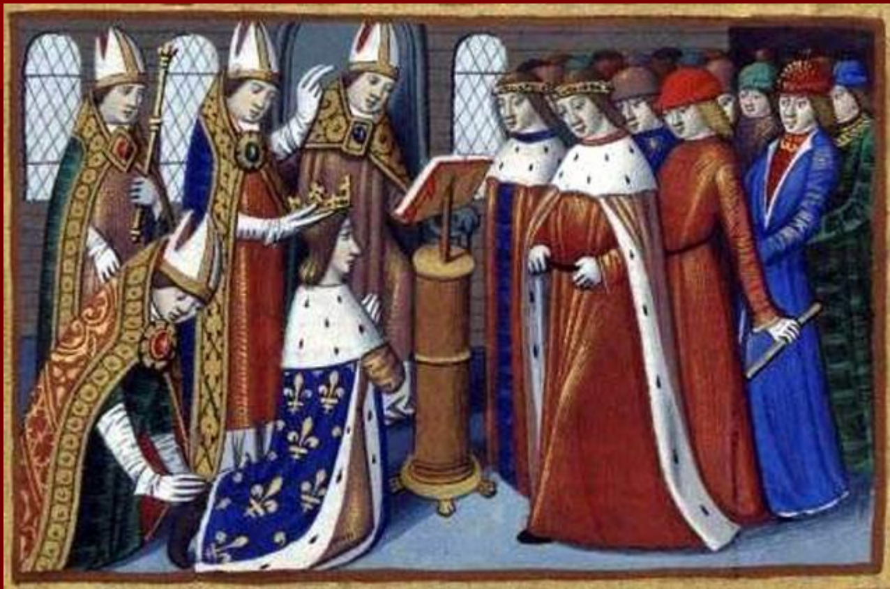
Коронация Карла VII в Реймсе

Но пока Карл не был коронован, он не считался законным королем. Жанна убедила его выступить в поход на Реймс — город, где издавна короновались французские короли. Весь путь до Реймса в 300 км армия прошла за две недели. Наследник престола был коронован в Реймском соборе. Вблизи короля со знаменем в руках стояла в рыцарских доспехах Жанна.