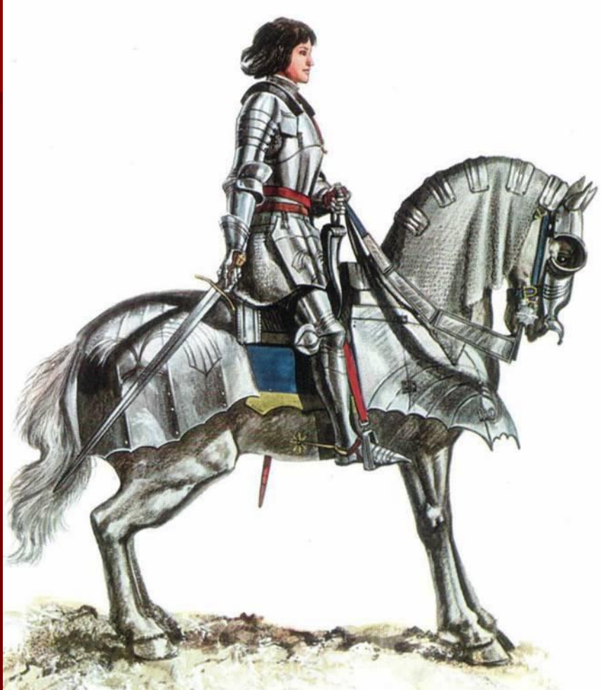
Жанна д'Арк в доспехе Реконструкция

Много трудностей пришлось преодолеть Жанне, чтобы принять участие в войне, которая считалась делом мужчин. В ближайшем городке ей удалось убедить коменданта крепости помочь ей. Он дал ей мужскую одежду, оружие и несколько воинов для сопровождения.