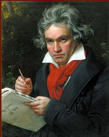
Людвиг ван Бетховен