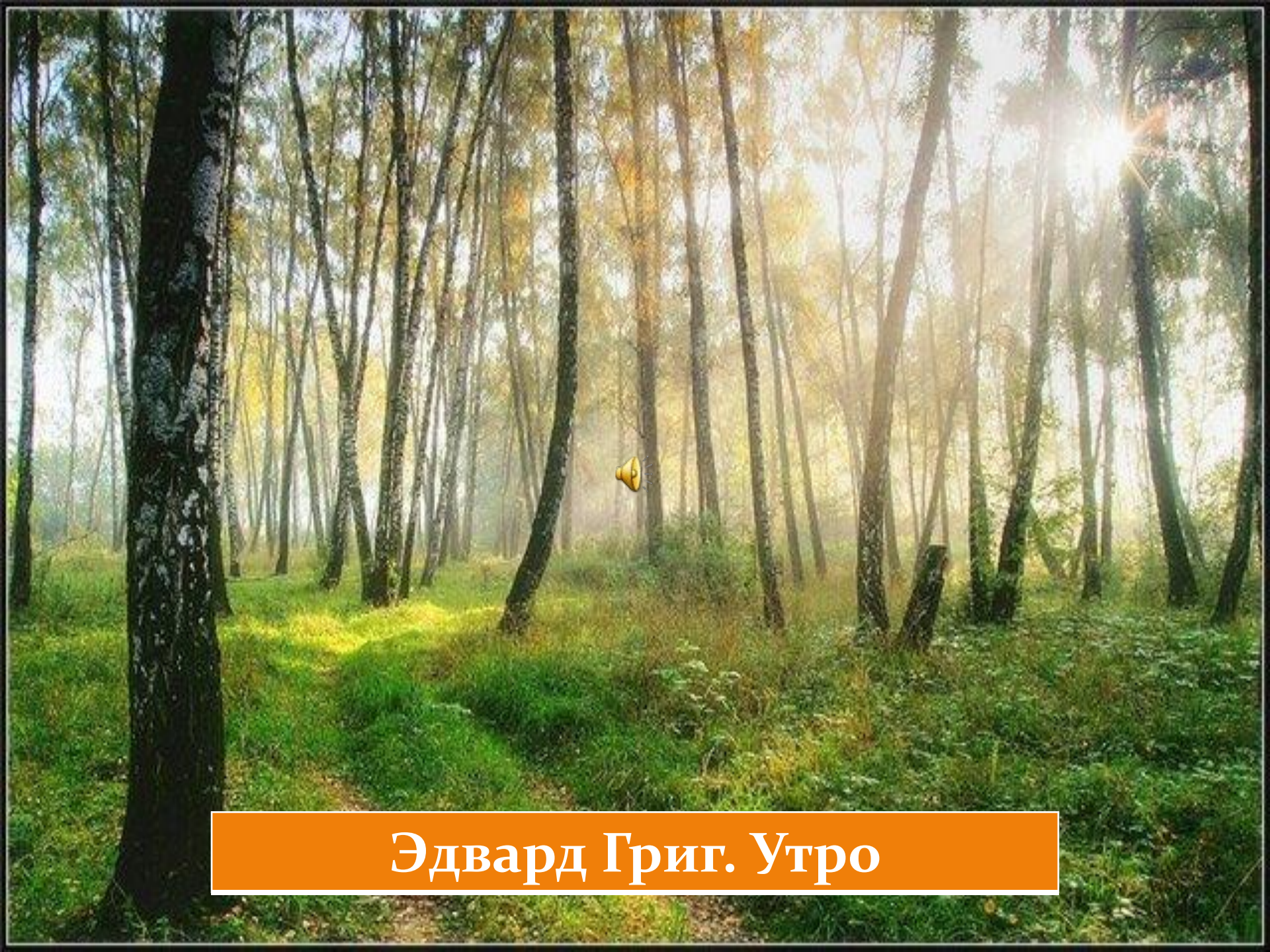
Эдвард Григ. Утро