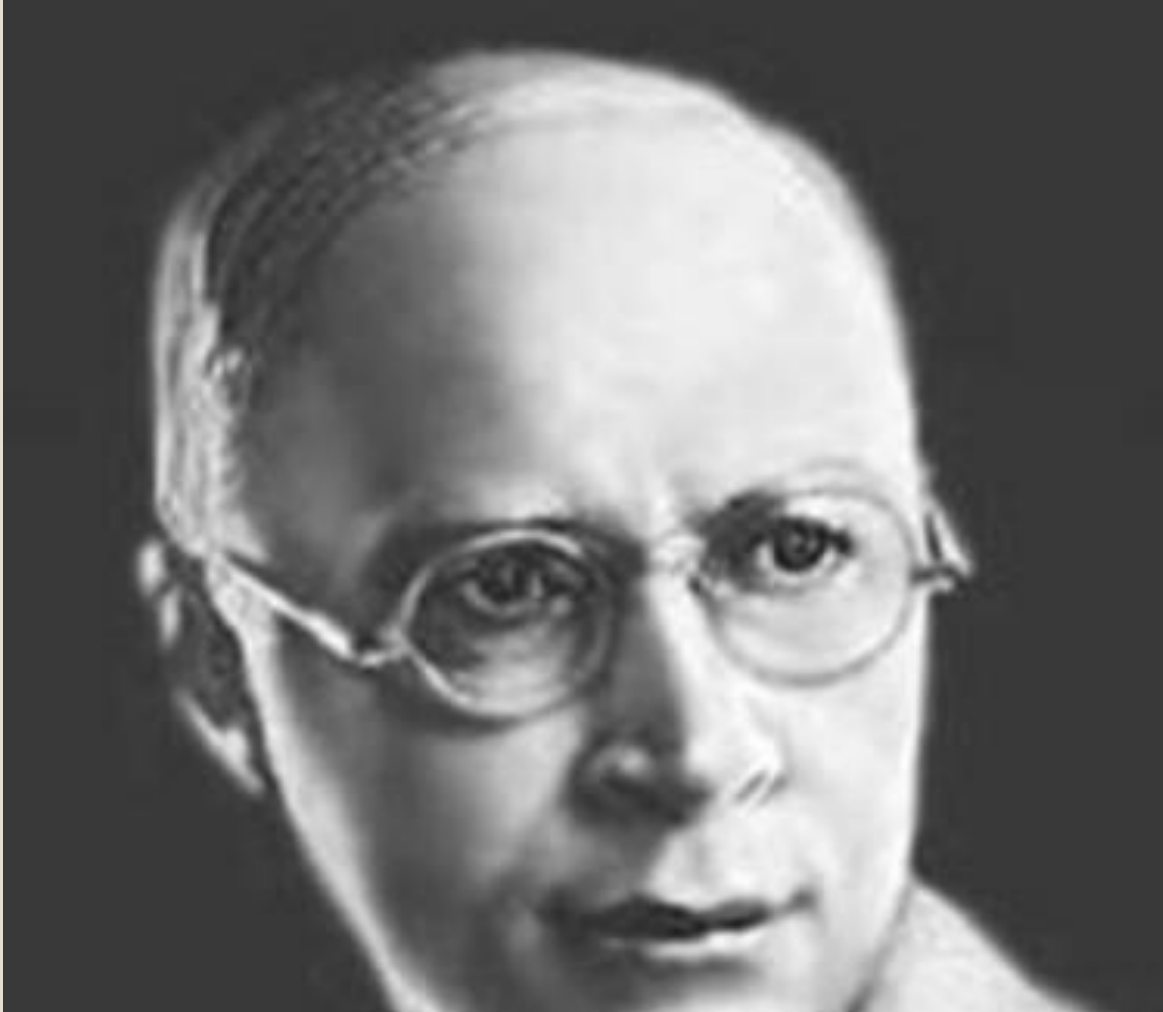
Сергей Сергеевич Прокофьев