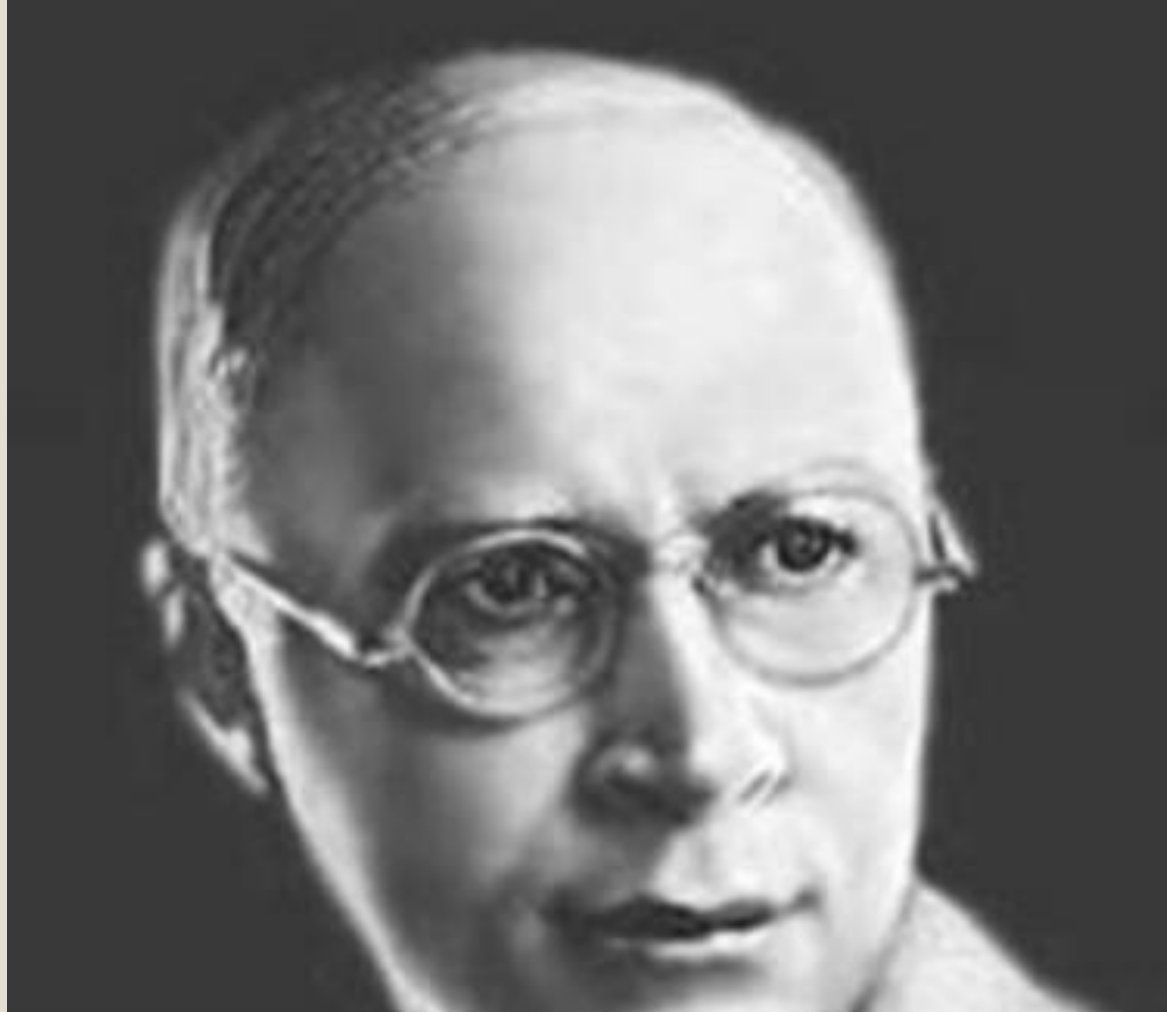
Сергей Сергеевич Прокофьев