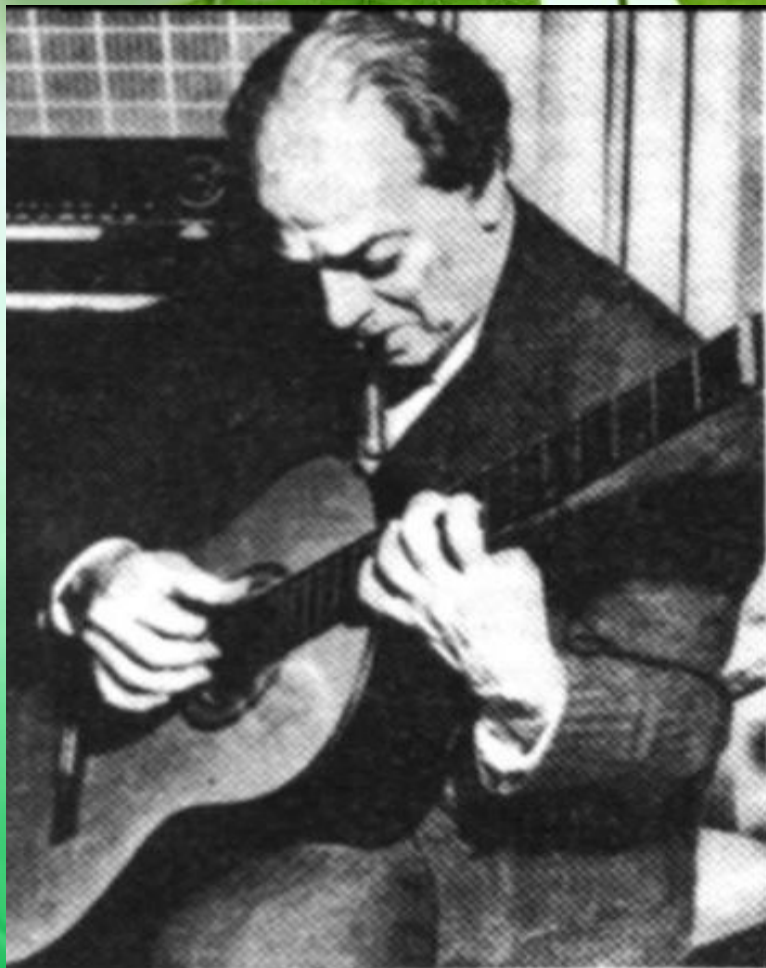
HEITOR VILLA LOBOS

Родился в городе Рио-де-Жанейро, – выдающийся бразильский композитор, знаток музыкального фольклора, дирижер, педагог.