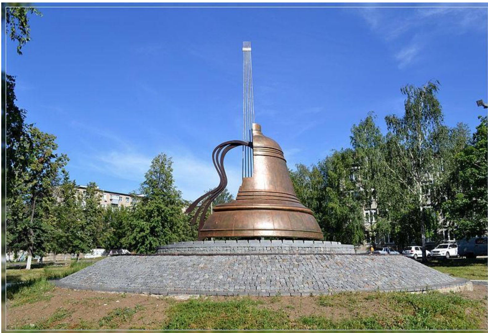
Памятник Высоцкому в Набережных Челнах