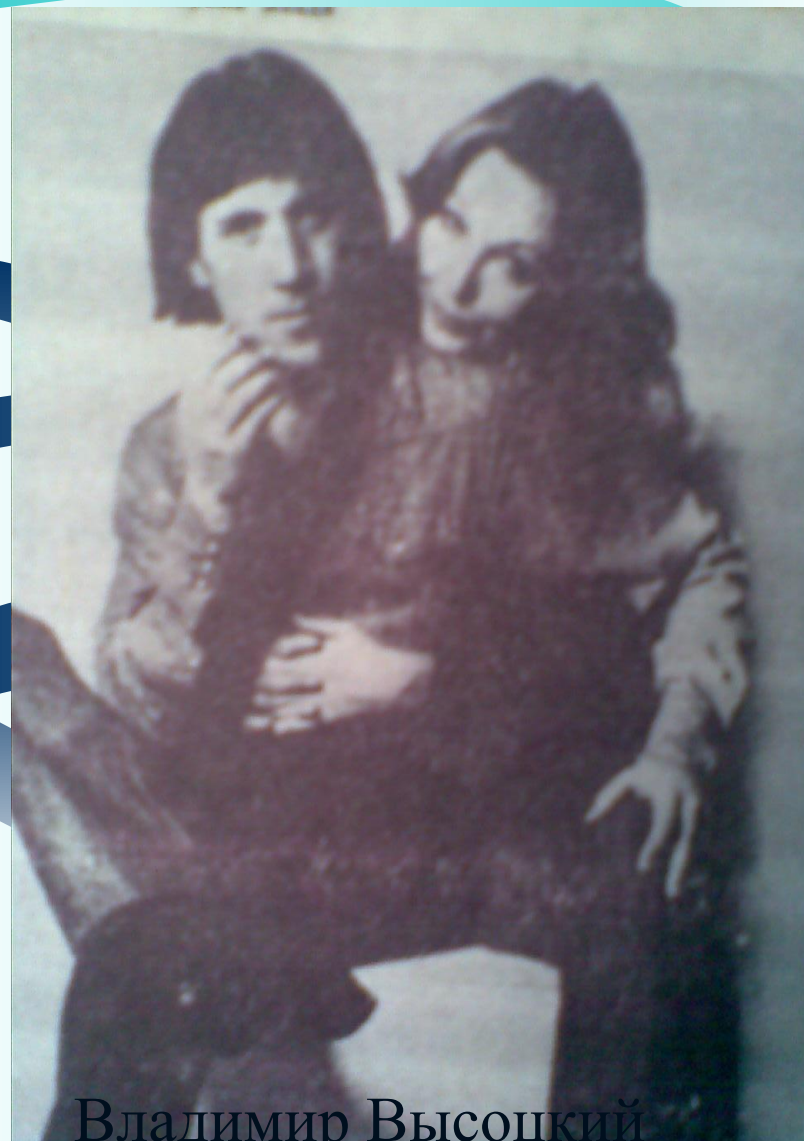
Владимир Высоцкий и Марина Влади

Актера-сочинителя с гитарой, поющего необычные по «вольности суждений» и манере исполнения песни, скоро заметили, он стал популярным.