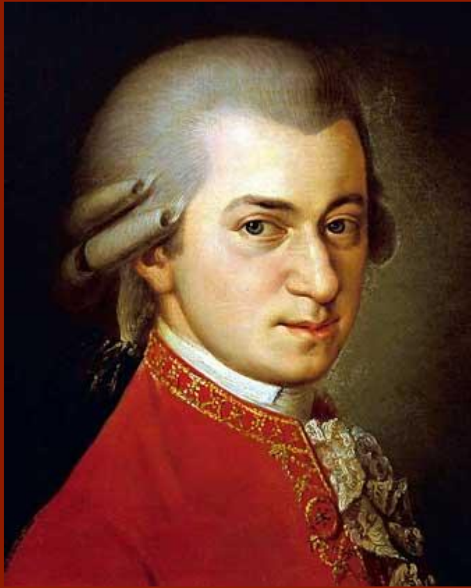
Б.Крафт. Портрет Моцарта. 1814 г.