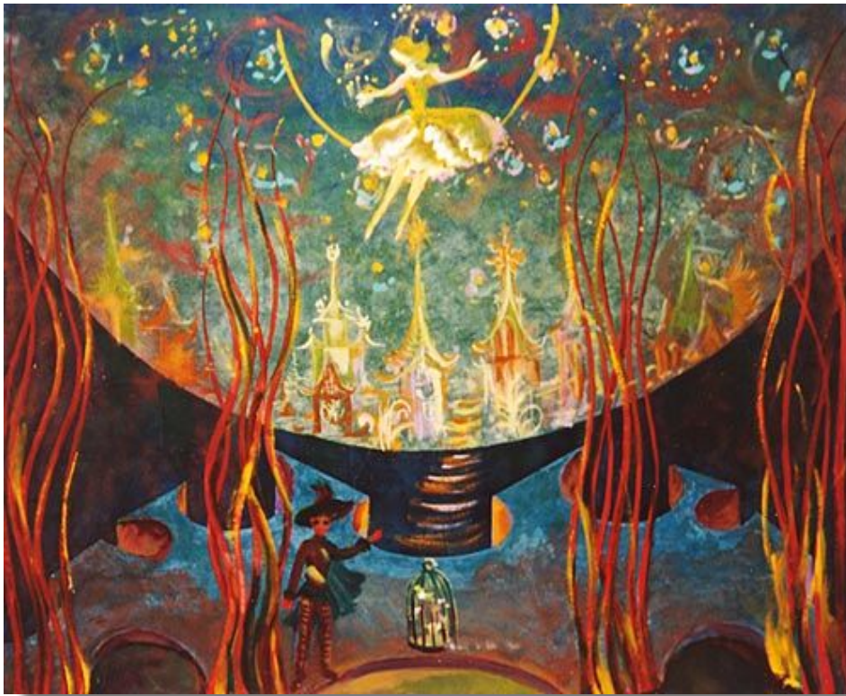
Эскиз декораций к опере «Волшебная флейта»