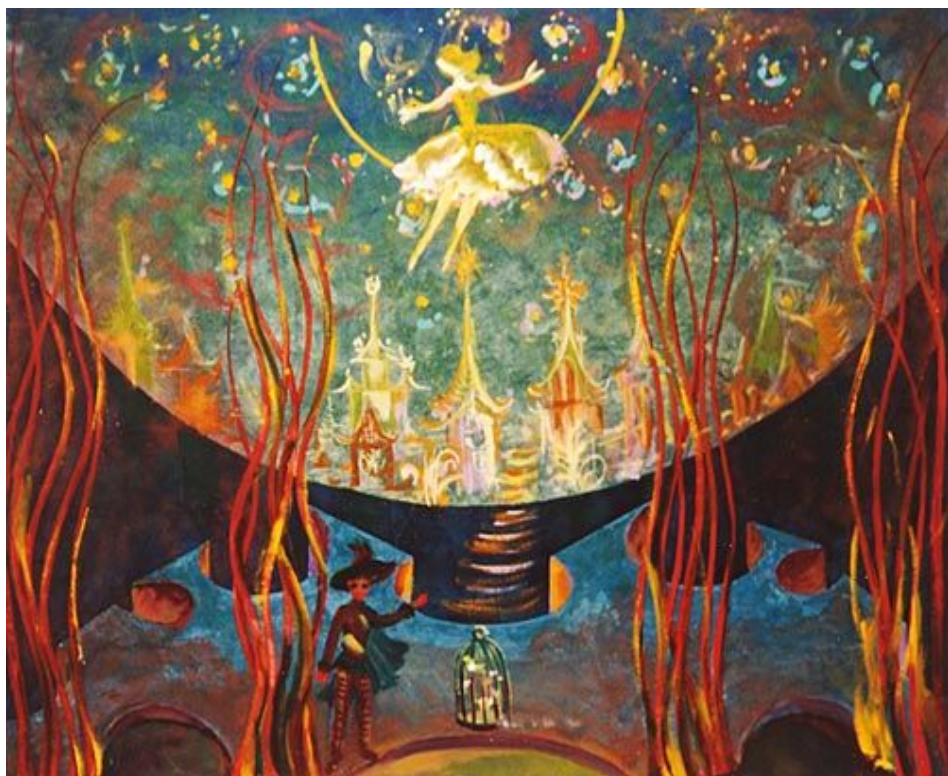
Эскиз декораций к опере «Волшебная флейта»