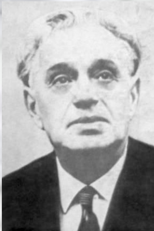
Музыка К. Листова