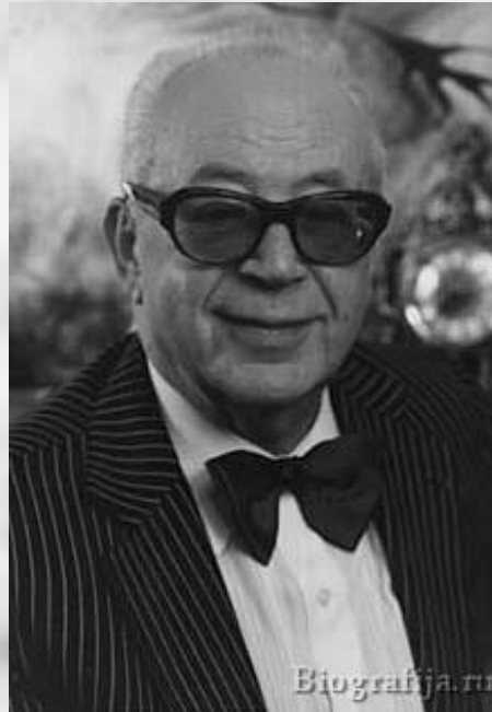
Музыка Н. Богословского