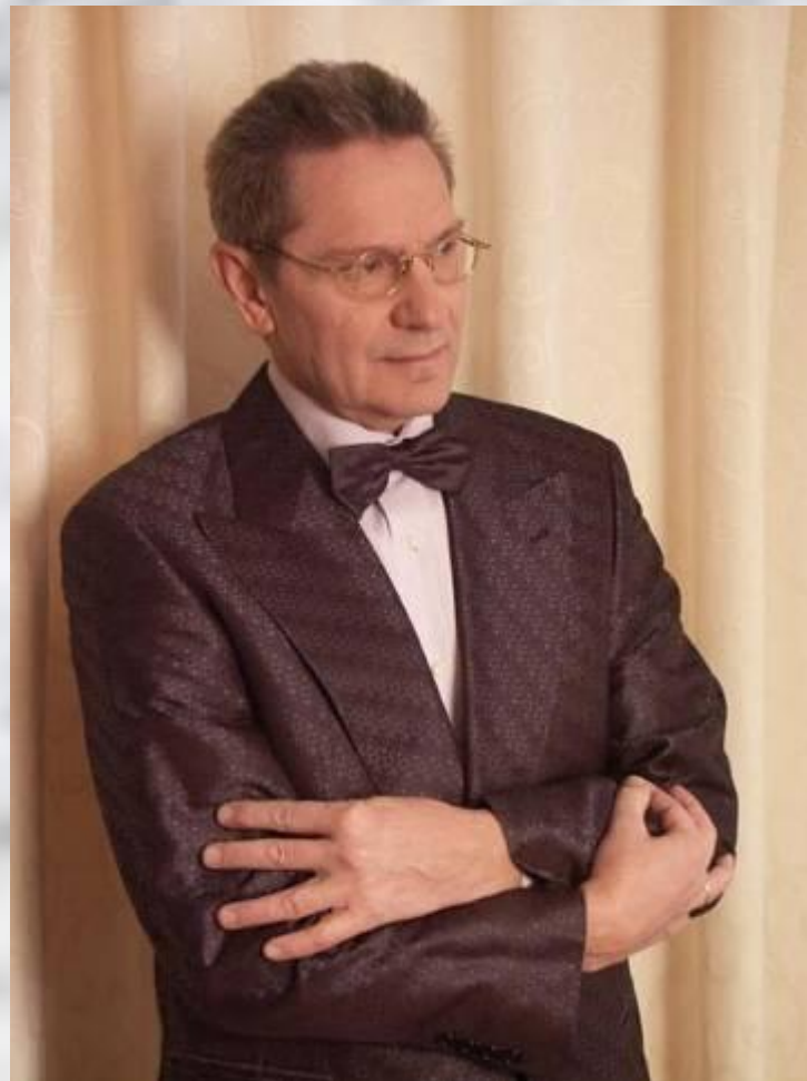
Музыка Давида Тухманова