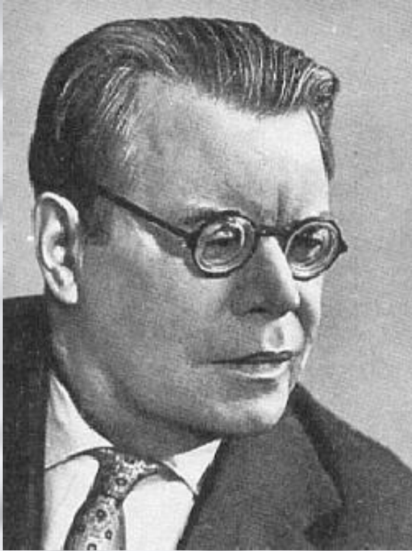
Слова М. Исаковского