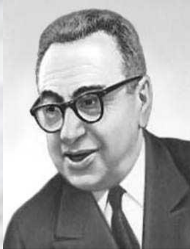
Музыка М. Блантера