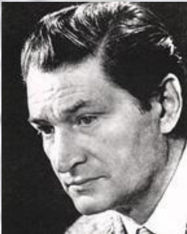
Слова Владимира Харитонова