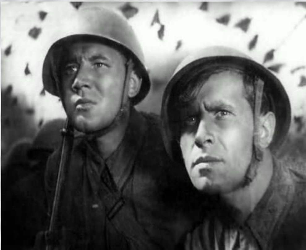
Из к/ф «Два бойца»

История создания всенародно любимой песни «Тёмная ночь» очень интересна. В 1943 году, во время работы над знаменитым к/ф «Два бойца» у режиссёра Леонида Лукова не получалось снять эпизод написания солдатом письма. Расстроенному режиссёру неожиданно пришла мысль, что украшением сцены могла бы стать песня, передающая чувства бойца в момент написания письма родным. Леонид Луков поспешил к композитору Никите Богословскому. И уже через 40 минут мелодия была готова. После этого оба приехали к поэту Владимиру Агатову, который, в свою очередь, за пару-тройку часов написал легендарное стихотворение. Так была создана любимая и поныне песня «Тёмная ночь».