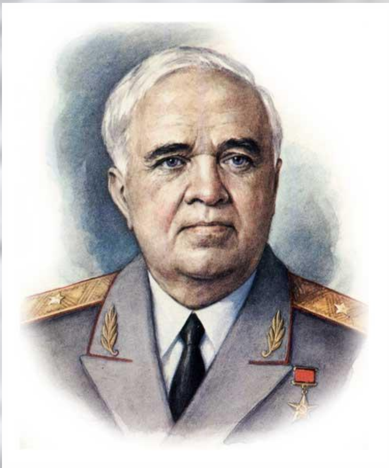
А. В. Александров

“Внезапное нападение вероломного врага на нашу Родину вызвало во мне, как и во всех советских людях, чувство возмущения и гнева. ...но у меня всё-таки оказалось могучее оружие в руках, это – песня. Песня, которая так же может разить врага. Как и любое оружие...”