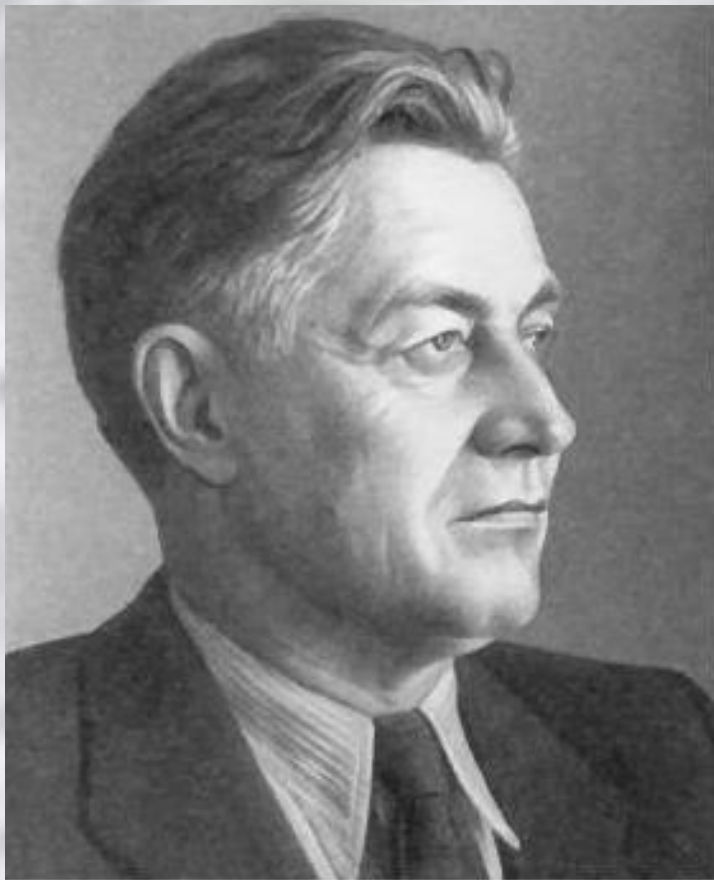
Слова А. А. Суркова