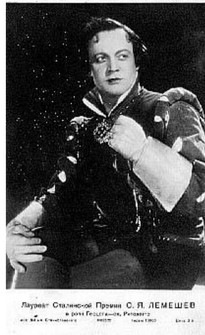
Партия Герцога опера «Риголетто» Верди

Среди многочисленных партий: Берендей опера «Садко» Римского-Корсакова, Звездочёт опера «Золотой петушок» Римского-Корсакова.