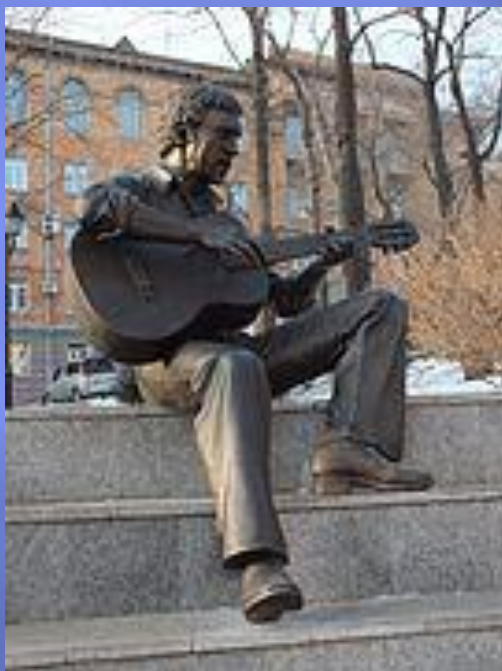
Памятник Высоцкому во Владивостоке