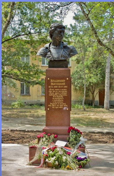
Памятник Высоцкому в Симферополе