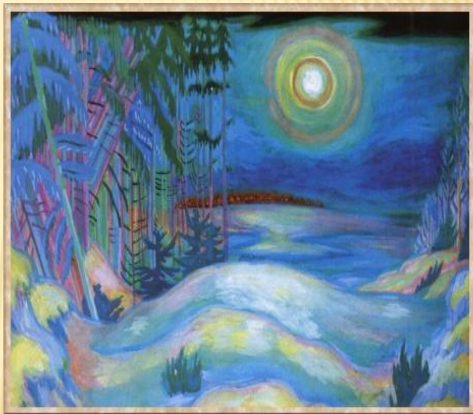
«Весенняя сказка» - Н. Островский