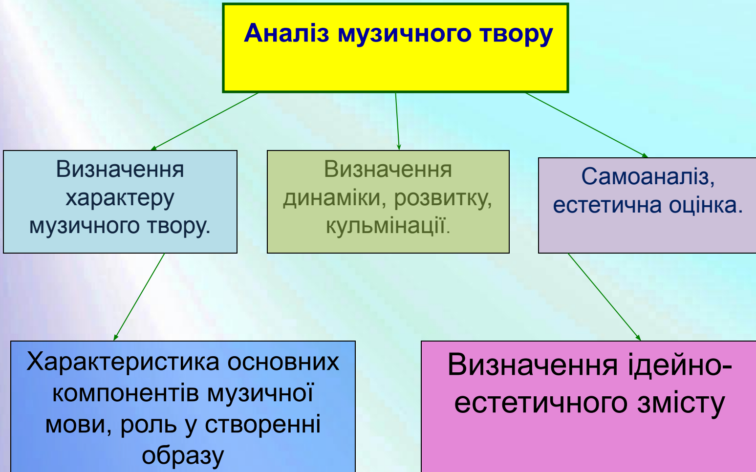
Схема аналізу музичного твору