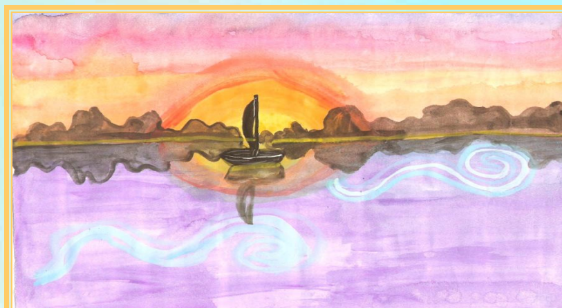
Музика Е. Гріга "Ранок" допомогла поетично намалювати пейзаж.

Інтерес до музики найбільш зачаровує й хвилює