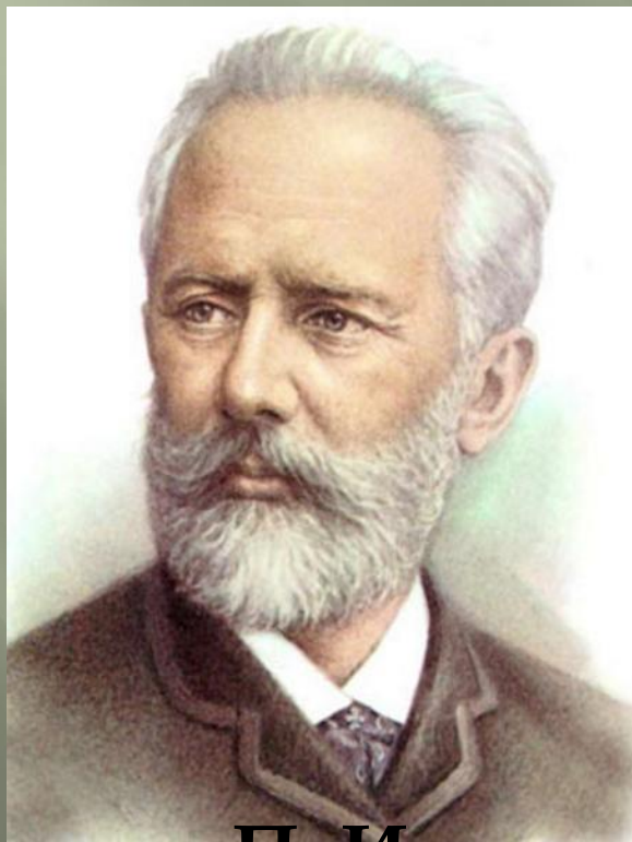
П. И. Чайковский