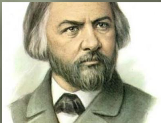
М. И. Глинка