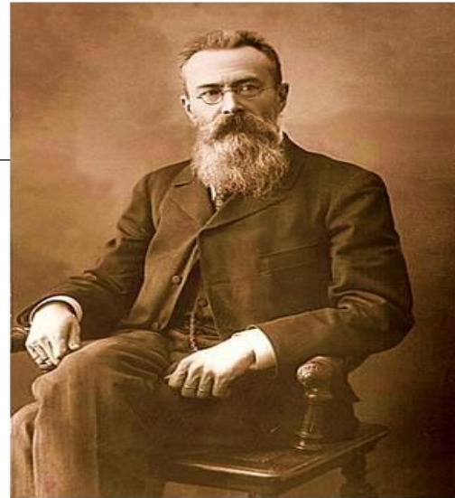
Николай Андреевич Римский-Корсаков