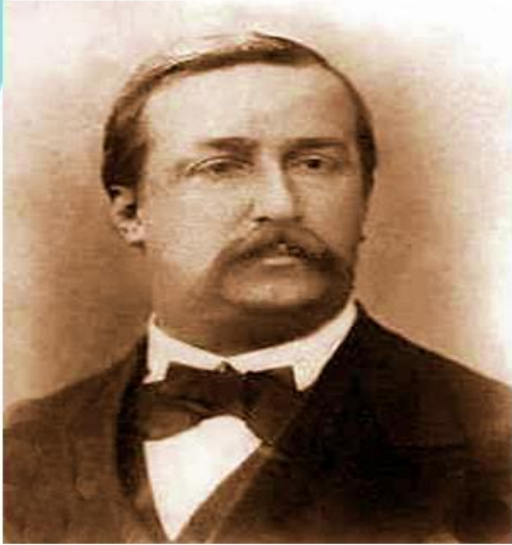
Александр Порфирьевич Бородин

Ни опера «Князь Игорь», ни Третья симфония не были завершены. 15 февраля 1887 года Бородин неожиданно скончался. Уже после его смерти Римский-Корсаков и Глазунов довели до конца то, что не успел окончить Александр Порфирьевич.