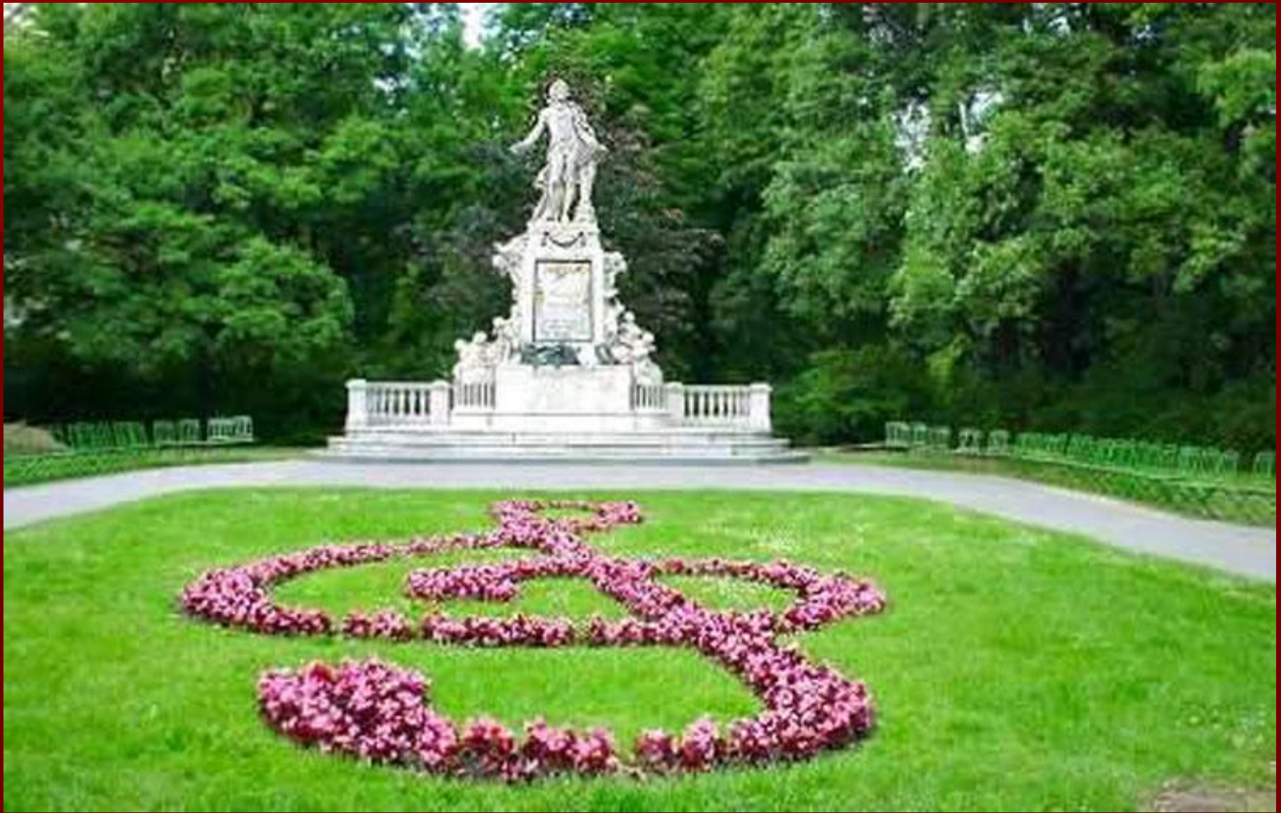
Памятник Моцарту в Вене