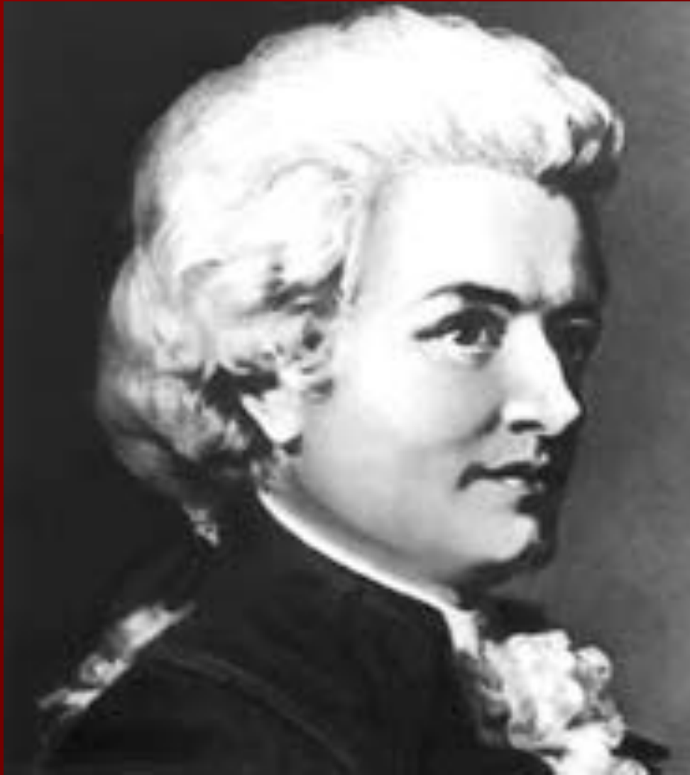
Вольфганг Амадей Моцарт (1756 – 1791)

Видный представитель Венской классической школы композиции. Был также виртуозным скрипачом, клавесинистом, органистом, дирижёром. По свидетельству современников, обладал феноменальным музыкальным слухом, памятью и способностью к импровизации.