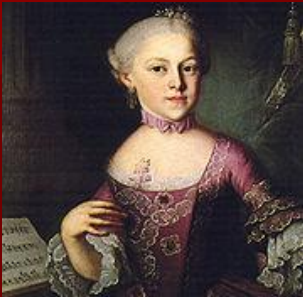
Мария Анна Моцарт, старшая сестра Вольфганга Амадея