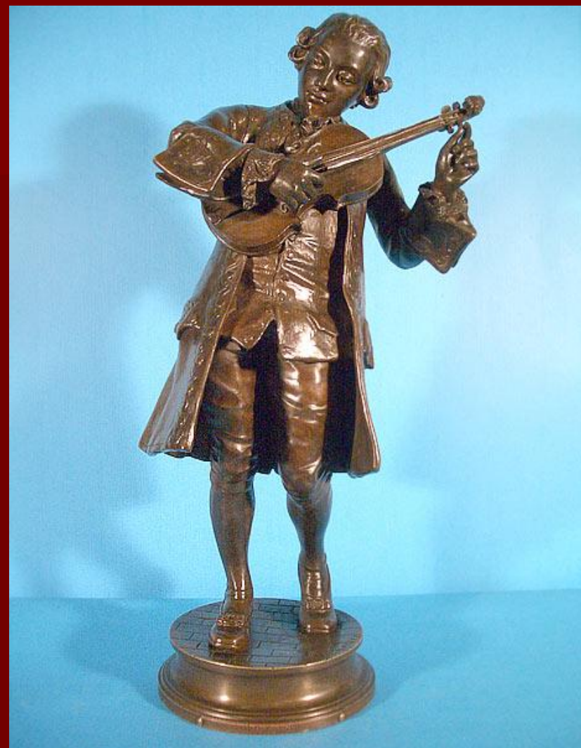
Бронзовые скульптуры Моцарта