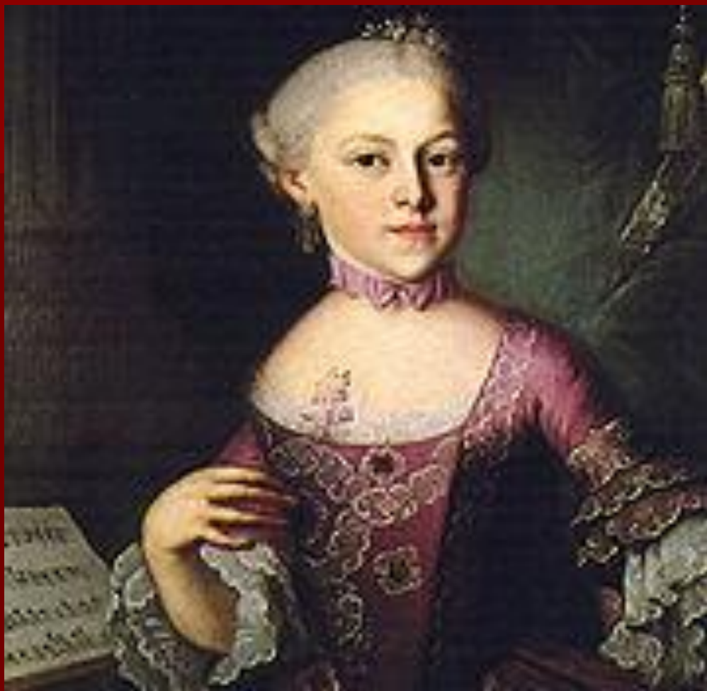
Мария Анна Моцарт, старшая сестра Вольфганга Амадея