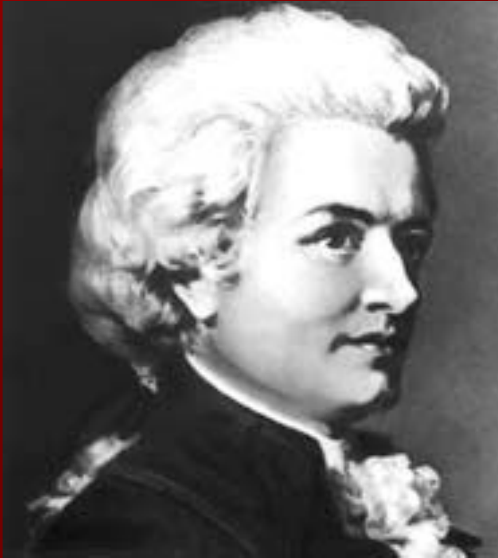
Вольфганг Амадей Моцарт (1756 – 1791)

Видный представитель Венской классической школы композиции. Был также виртуозным скрипачом, клавесинистом, органистом, дирижёром. По свидетельству современников, обладал феноменальным музыкальным слухом, памятью и способностью к импровизации.