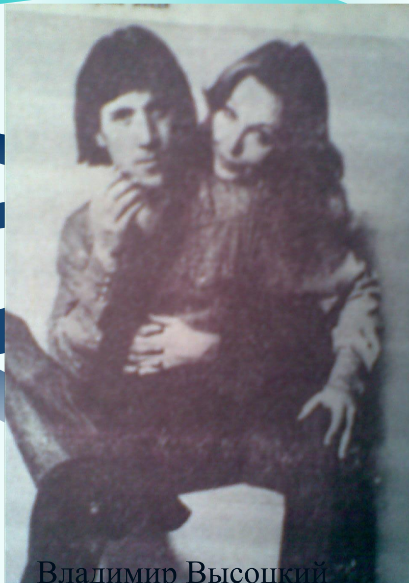
Владимир Высоцкий и Марина Влади

Актера-сочинителя с гитарой, поющего необычные по «вольности суждений» и манере исполнения песни, скоро заметили, он стал популярным.