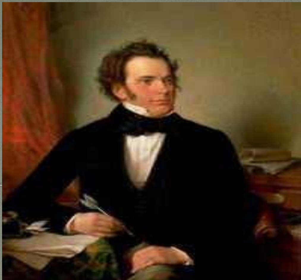
Франц Шуберт 1797 - 1828