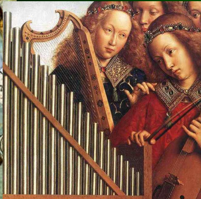
Я. Ван Эйк. Фрагменты картин