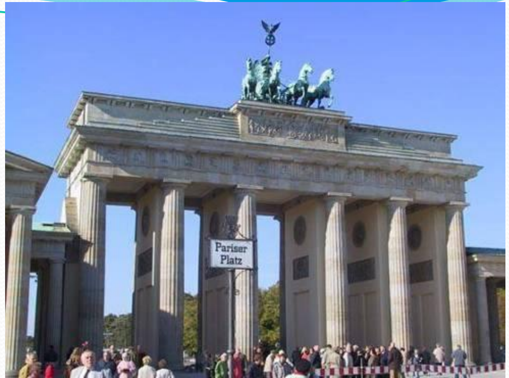
Das Brandenburger Tor