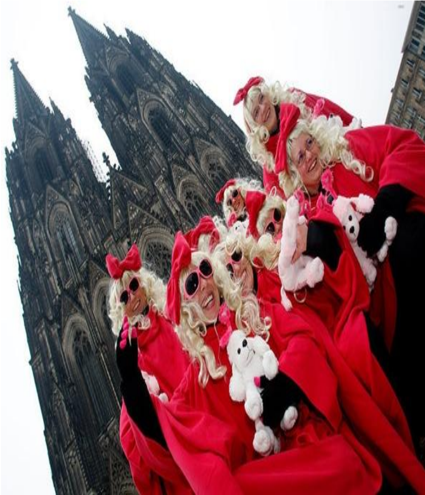
Карнавал в Кёльне

Наиболее популярен этот праздник на берегах реки Рейн. Самыми знаменитыми являются празднества в Кёльне, Майнце, Дюссельдорфе.