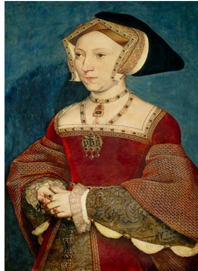
Hans Holbein der Jüngere “Portrait of Jane Seymour, Queen of England”