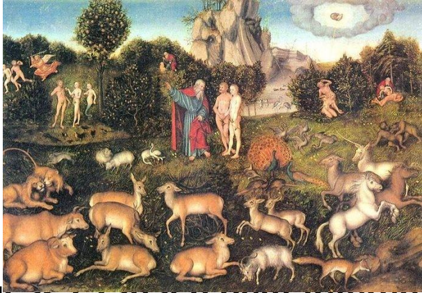
Lucas Cranach dem Älteren „The Garden of Eden“