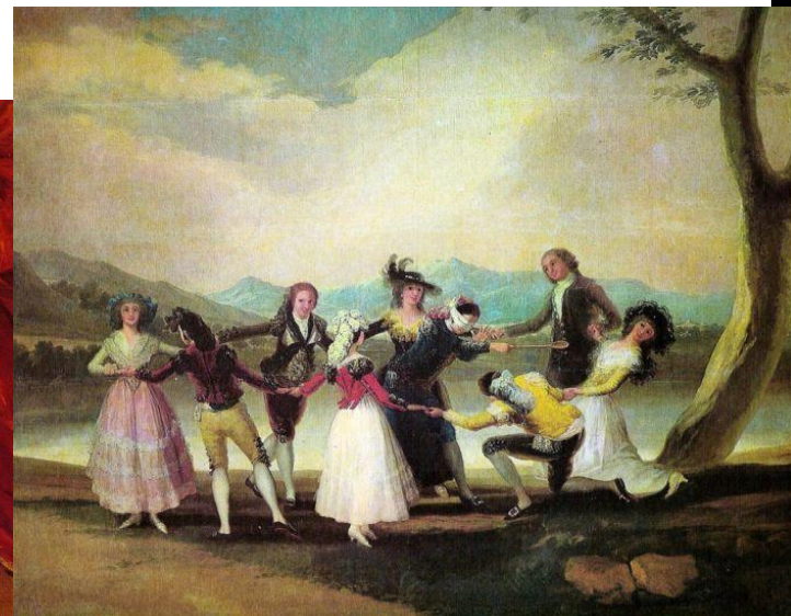
«Blind Mans Bluff»