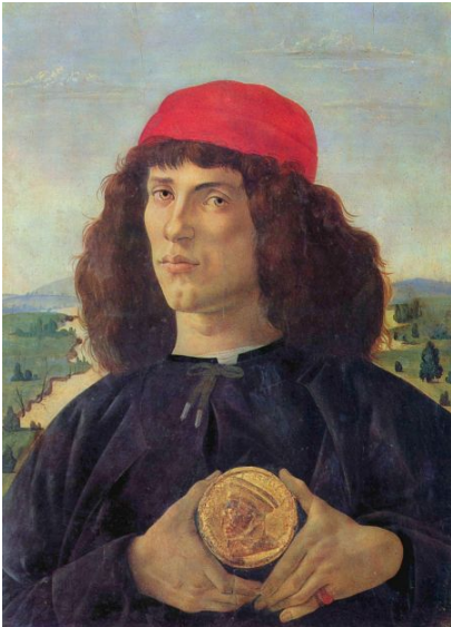
“PORTRAIT OF A MAN WITH A MEDAL BEFORE”