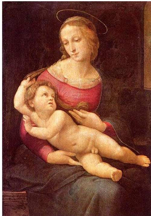
„The Madonna and Child”