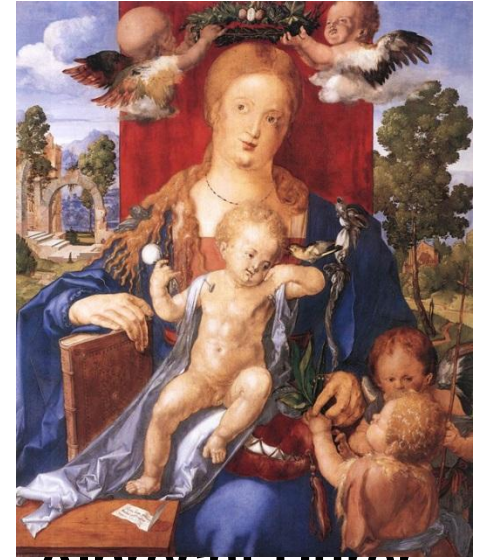
Albrecht Dürer „Madonna with the Siskin“