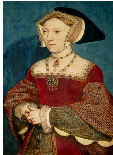
Hans Holbein der Jüngere “Portrait of Jane Seymour, Queen of England”