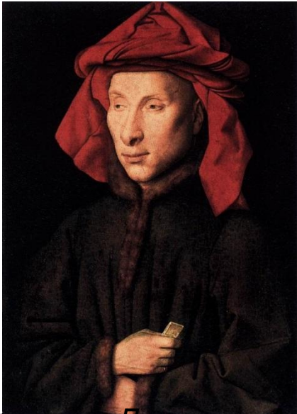
„Портрет Джованни Арнольфини“