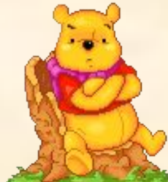
Der traurige Bär