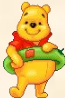
Der lustige Bär