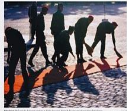
Bush besucht Osteuropa Der amerikanische Präsident George W. Bush ist in Osteuropa. Bush besucht Osteuropa. Bush besucht Osteuropa.

PAZ. FRANKFURT. 11. Juni. Die Linke will mit der SPD kooperieren, teilte die Partei heute mit. Die Linke will mit der SPD kooperieren, teilte die Partei heute mit. Die Linke will mit der SPD kooperieren, teilte die Partei heute mit.