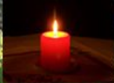
die Kerze brennt