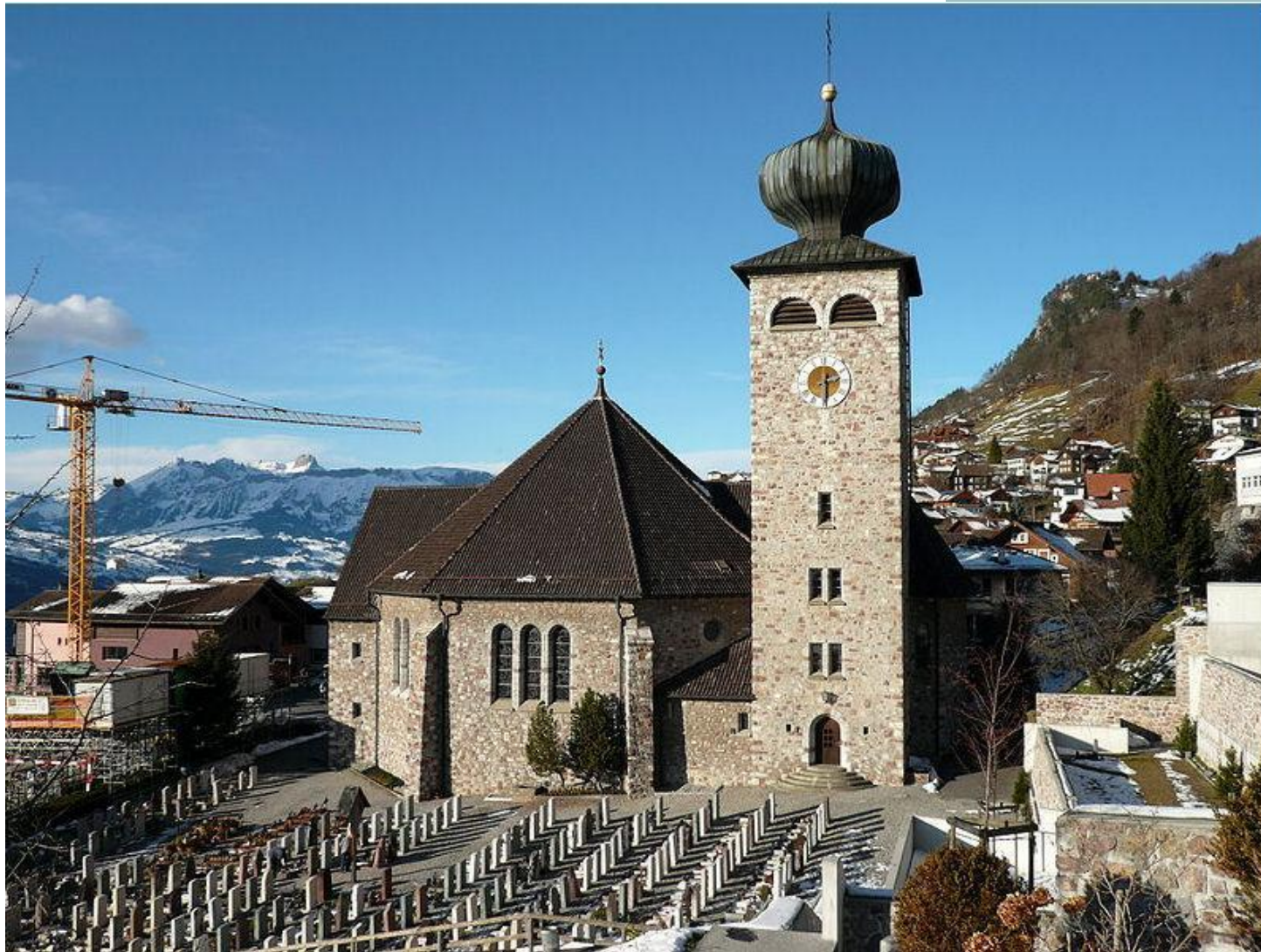
Kirche von Triesenberg