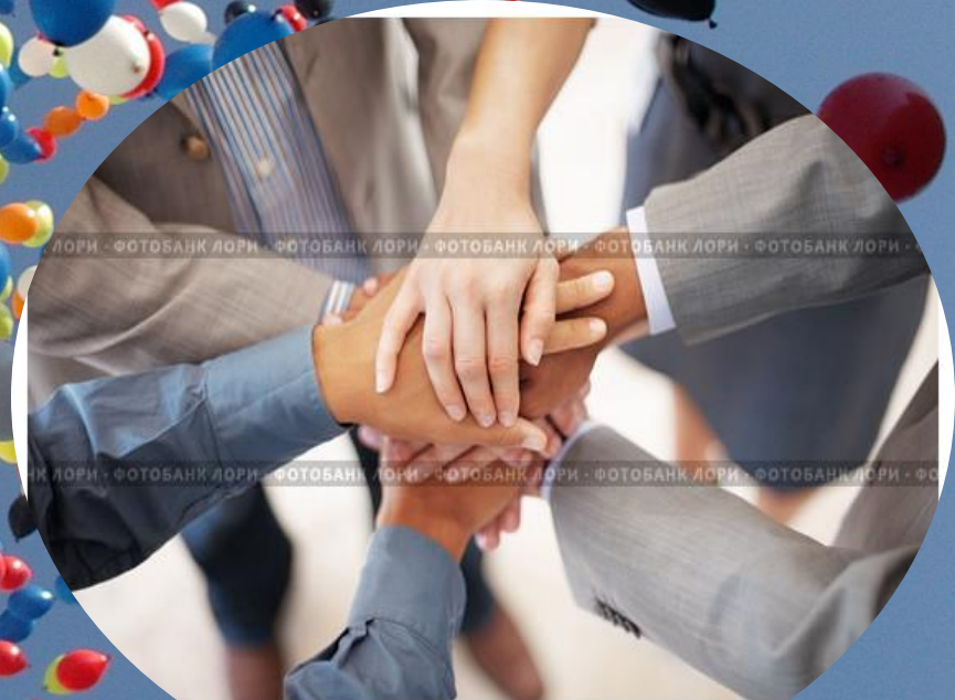
Сильное рукопожатие