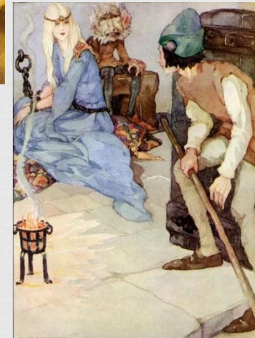
Der starke Hans