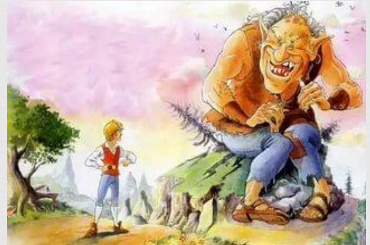
Das tapfere Schneiderlen