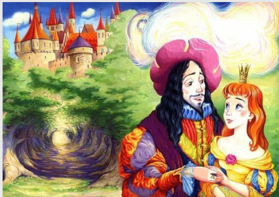
Der Froschkönig oder der eiserne Heinrich