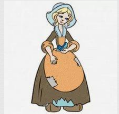
Die goldene Gans