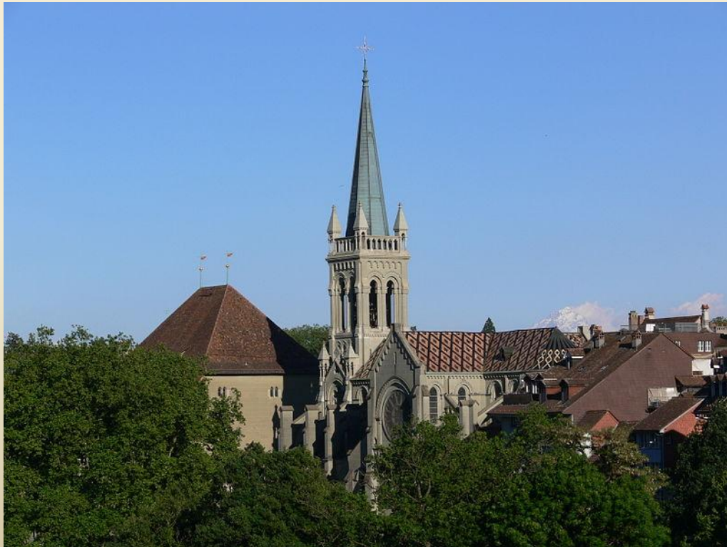
Церковь Святого Петра и Павла