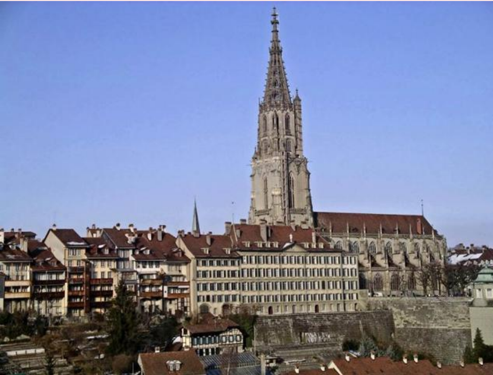
Бернский кафедральный собор